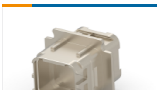
TE 产品编号ZPF000000000167612 DMC-MD 26 N-T