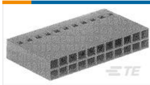
TE 产品编号 104482-8 18 SHORT PT RCPT HSG DR .100CL