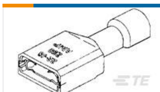
TE 产品编号2-521308-2 205 ULTRA-FAST RCPT 22-18 TPBR