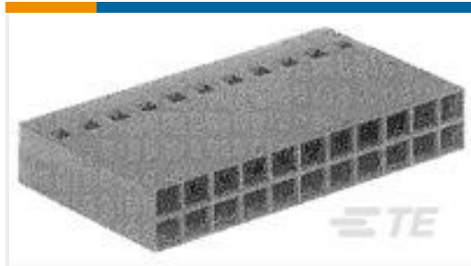
TE 产品编号 104482-7 16 SHORT PT RCPT HSG DR .100CL