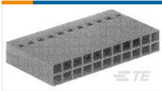
TE 产品编号 104482-6 14 SHORT PT RCPT HSG DR .100CL