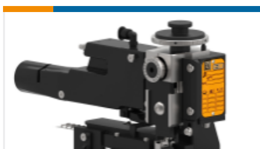
TE 产品编号2836135-2 OCEAN_2.0_APPLICATOR-S-033F0550A