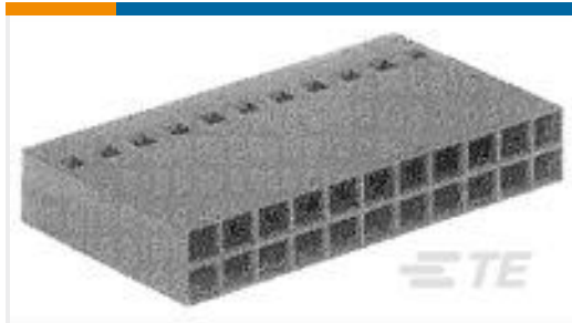
TE 产品编号 104482-1 04 SHORT PT RCPT HSG DR .100CL