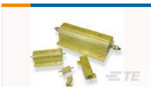
TE 产品编号6-1625999-3 HSC100 12R 5%