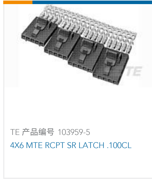
TE 产品编号 103959-5 4X6 MTE RCPT SR LATCH .100CL