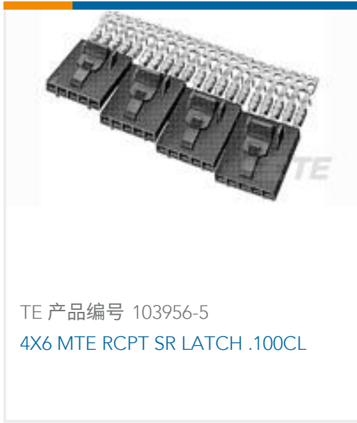
TE 产品编号 103956-5 4X6 MTE RCPT SR LATCH .100CL