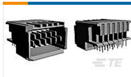
TE 产品编号120957-2 UPM EXPANDED PIN ASSEMBLY