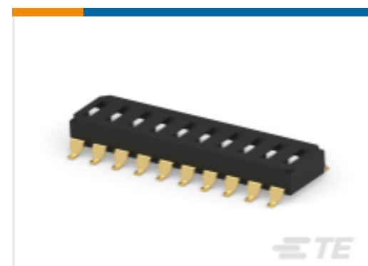
TE 产品编号3-2319848-1 END STACK DIP 10P G RECESS SEAL TUBE