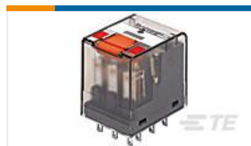
TE 产品编号3-1415020-1 PT570N20