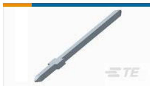
TE 产品编号1-928836-2 MOD2 PIN WITH A-PIN L/P