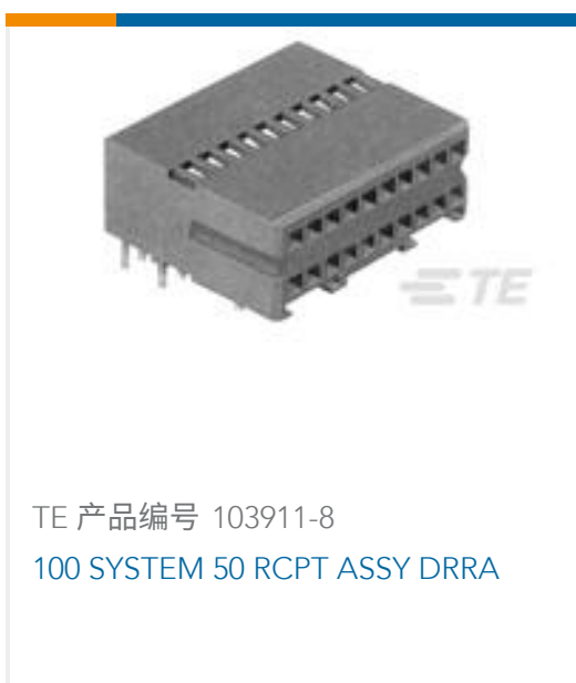
TE 产品编号 103911-8 100 SYSTEM 50 RCPT ASSY DRRA