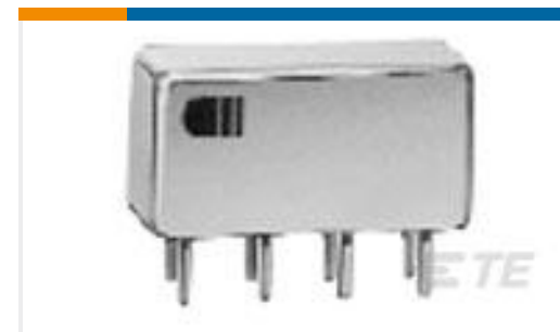
TE 产品编号2-1617031-4 HFW1201K46M = M39016/6-209M