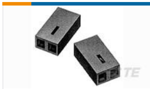
TE 产品编号530153-2 TDM SPRING SHUNT ASSY 2 POS