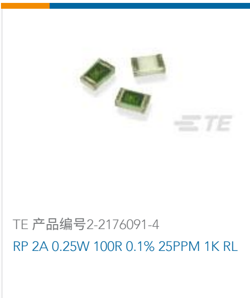
TE 产品编号2-2176091-4 RP 2A 0.25W 100R 0.1% 25PPM 1K RL