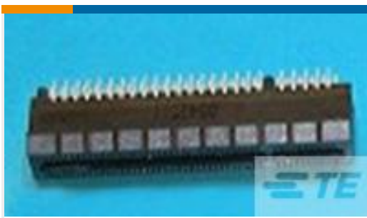
TE 产品编号5650118-3 CONN SEC II 6 POS 100C/L R/A