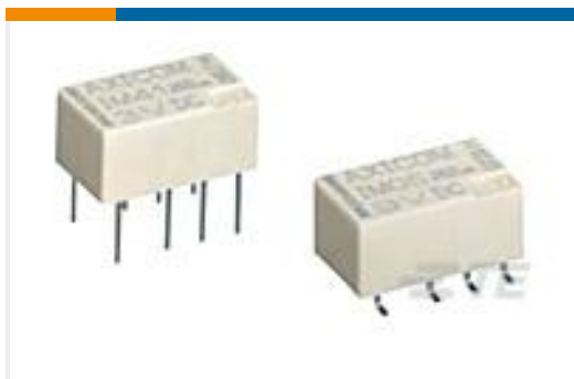
TE 产品编号4-1462039-1 IM42CGR=IM RELAY 100mW 4.5V BIS