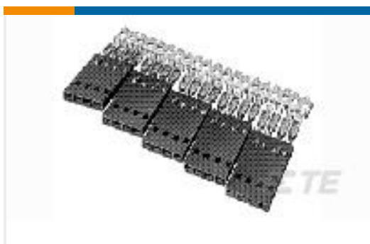
TE 产品编号5-103975-2 8X3 MTE RCPT SR PLAIN .100CL