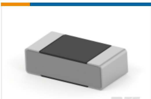
TE 产品编号3-2176263-7 RN 0402 57K6 0.1% 10PPM 5K RL