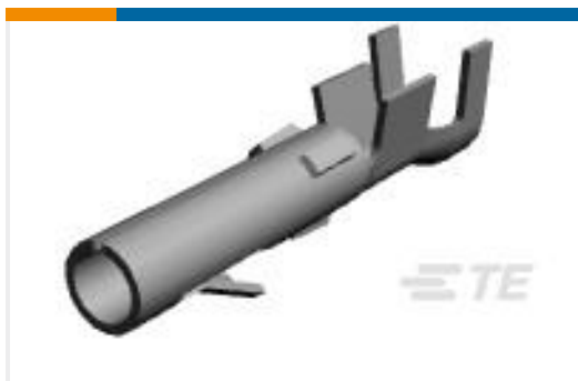
TE 产品编号61117-6 CMNL SOK 20-14 AUPHBZ