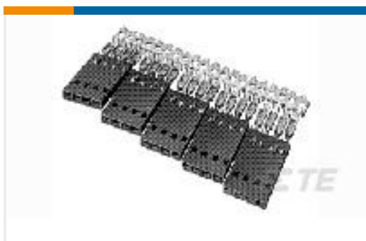
TE 产品编号103976-2 8X3 MTE RCPT SR PLAIN .100CL