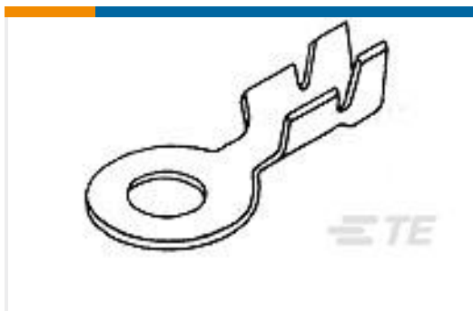
TE 产品编号42721-1 RING TONGUE CRIMP 20-16 AWG BR