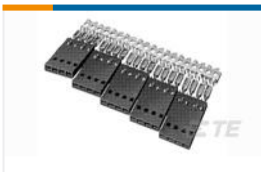
TE 产品编号104439-2 5X3 MTE RCPT SR PLAIN .100CL