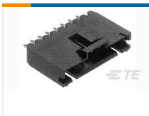
TE 产品编号 103735-6 07 MTE HDR SRST LATCH .100CL