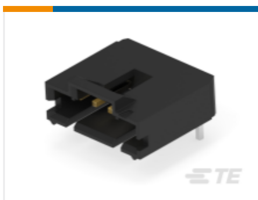
TE 产品编号 5-104935-6 05 MTE HDR SRRA LATCH.100CL LF