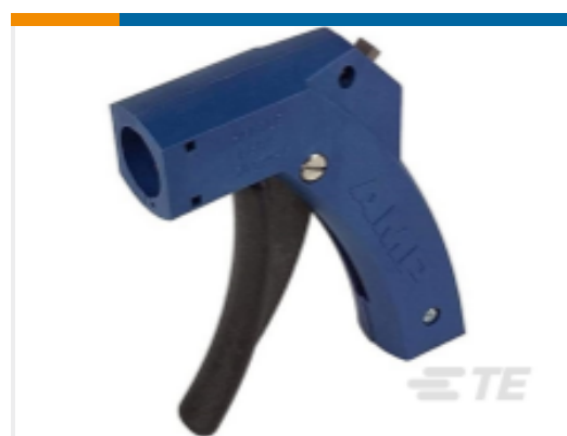
TE 产品编号 58074-1 MTA 50/100/156 MANUAL TOOL FRAME