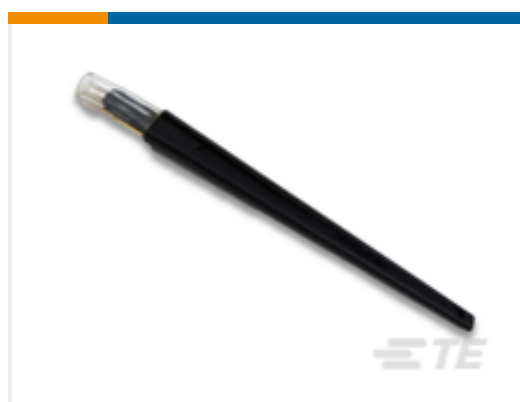
TE 产品编号 843477-1 TOOL, EXTRACTION RESET