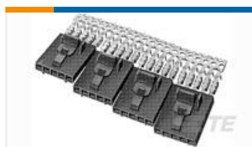
TE 产品编号5-103956-5 4X6 MTE RCPT SR LATCH .100CL