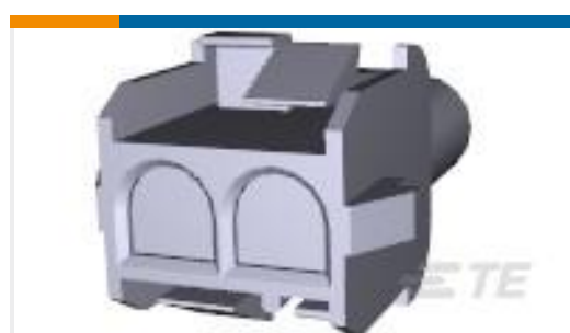
TE 产品编号1-480699-0 02P UMNL CAP HSG NATL