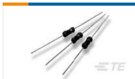
TE 产品编号7-1625890-0 2W SM M/OX 5% 82K