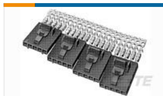
TE 产品编号1-103957-7 2X8 MTE RCPT SR LATCH .100CL