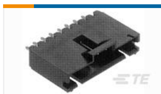
TE 产品编号5-103735-3 04 MTE HDR SRST LATCH .100CL