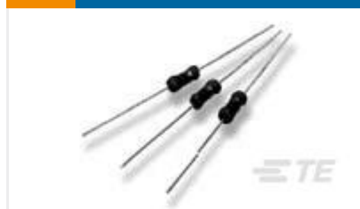
TE 产品编号4-1625892-9 3W SM M/OX 5% 3R3