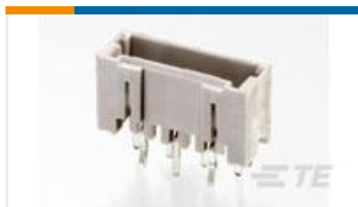
TE 产品编号292207-8 MINI CT SGL DIP V 8P NAT