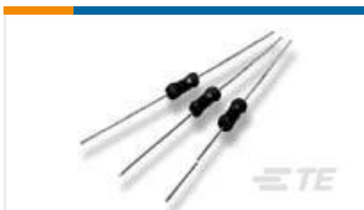
TE 产品编号9-1625892-2 3W SM M/OX 5% 2R7