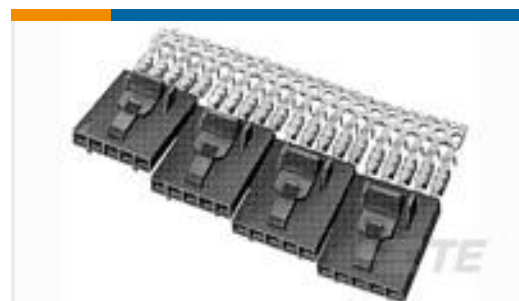
TE 产品编号103957-4 4X5 MTE RCPT SR LATCH .100CL