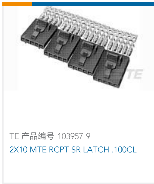
TE 产品编号 103957-9 2X10 MTE RCPT SR LATCH .100CL