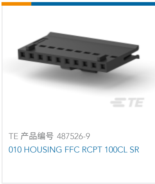
TE 产品编号 487526-9 010 HOUSING FFC RCPT 100CL SR