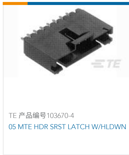
TE 产品编号 103670-4 05 MTE HDR SRST LATCH W/HLDWN