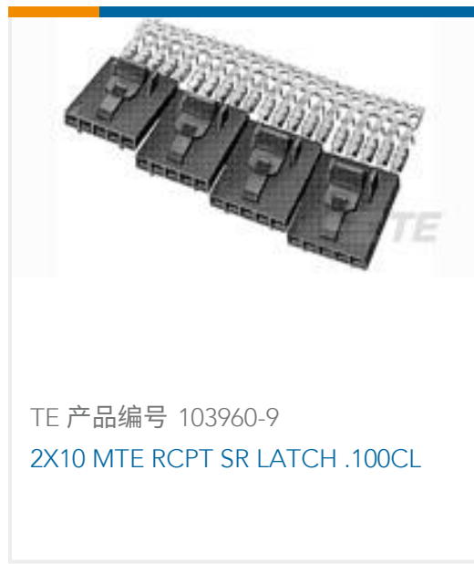
TE 产品编号 103960-9 2X10 MTE RCPT SR LATCH .100CL