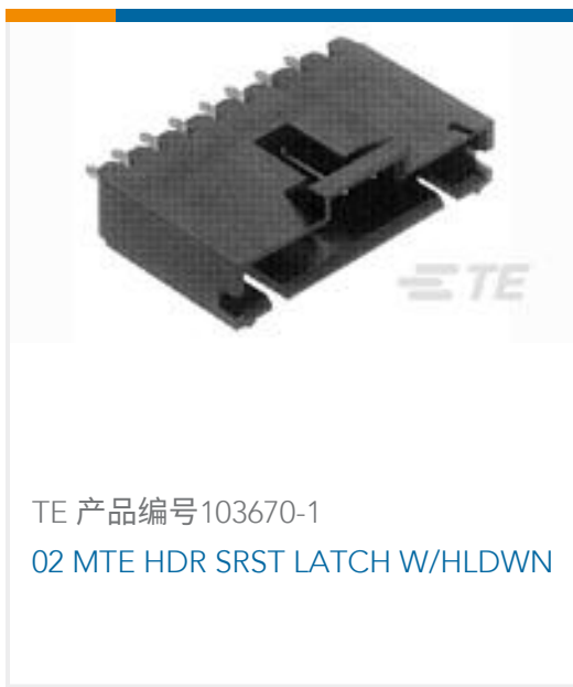
TE 产品编号 103670-1 02 MTE HDR SRST LATCH W/HLDWN