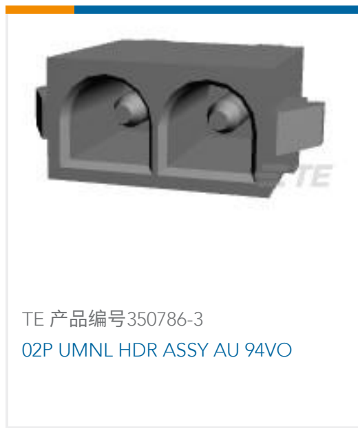
TE 产品编号 350786-3 02P UMNL HDR ASSY AU 94VO