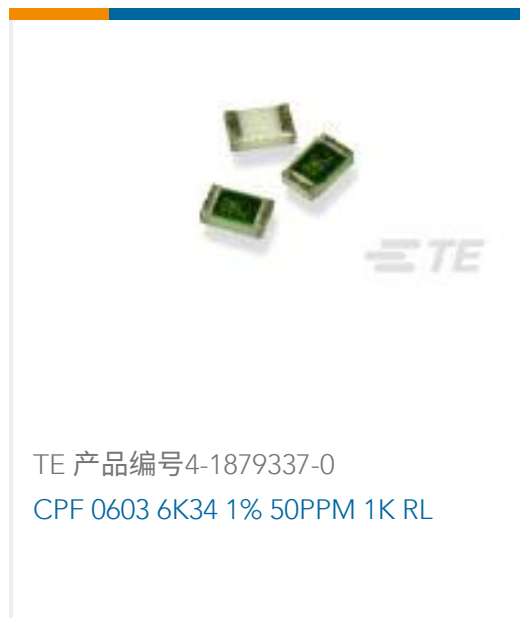
TE 产品编号 4-1879337-0 CPF 0603 6K34 1% 50PPM 1K RL