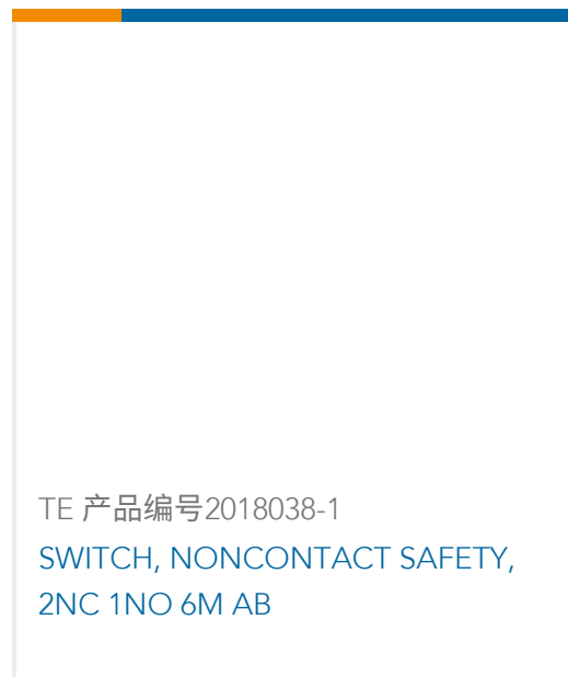
TE 产品编号 2018038-1 SWITCH, NONCONTACT SAFETY, 2NC 1NO 6M AB