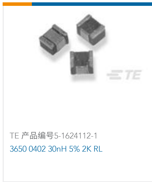
TE 产品编号 5-1624112-1 3650 0402 30nH 5% 2K RL