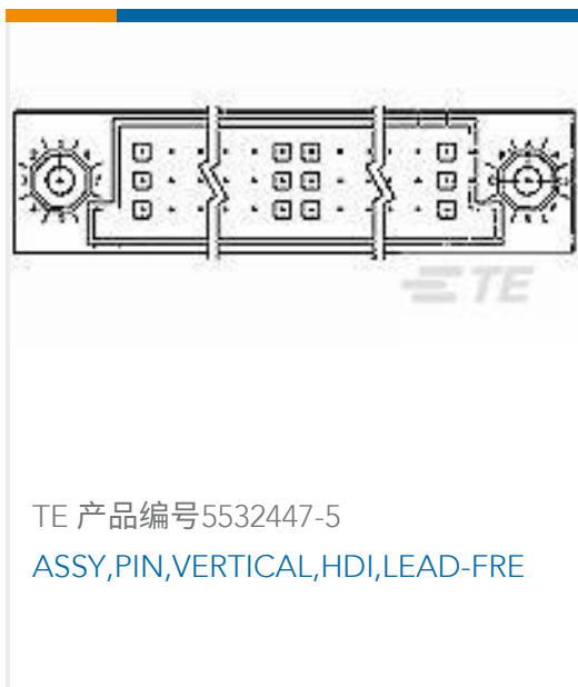
TE 产品编号 5532447-5 ASSY,PIN,VERTICAL,HDI,LEAD-FRE