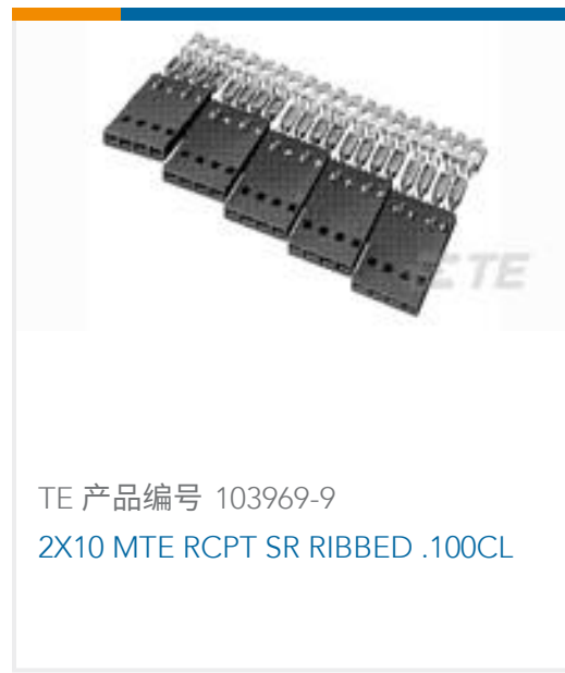
TE 产品编号 103969-9 2X10 MTE RCPT SR RIBBED .100CL