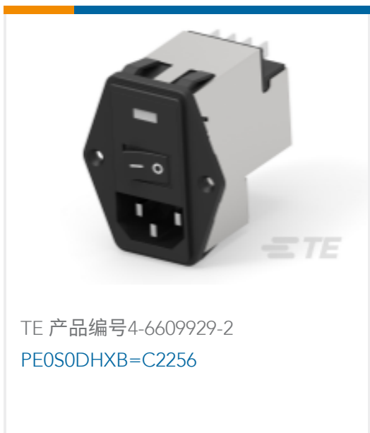
TE 产品编号 4-6609929-2 PE0S0DHXB=C2256