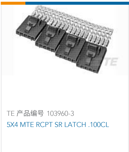
TE 产品编号 103960-3 5X4 MTE RCPT SR LATCH .100CL