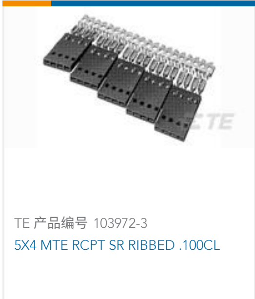
TE 产品编号 103972-3 5X4 MTE RCPT SR RIBBED .100CL