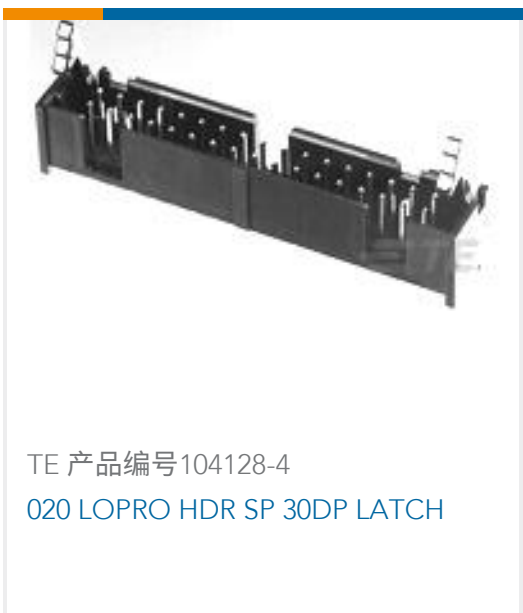
TE 产品编号 104128-4 020 LOPRO HDR SP 30DP LATCH