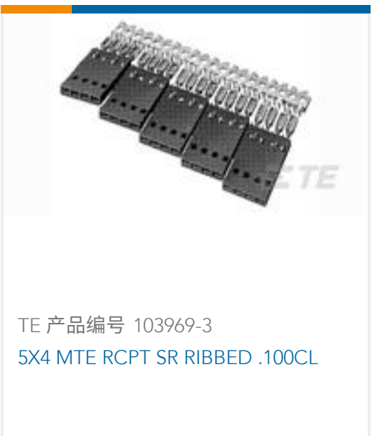
TE 产品编号 103969-3 5X4 MTE RCPT SR RIBBED .100CL