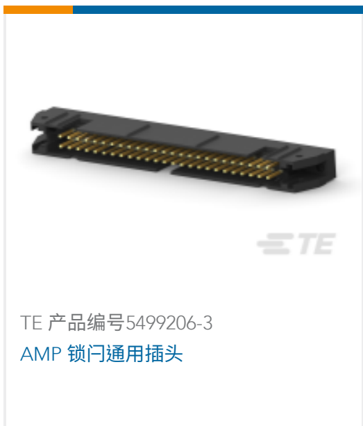
TE 产品编号 5499206-3 AMP 锁门通用插头