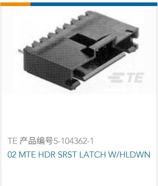
TE 产品编号 5-104362-1 02 MTE HDR SRST LATCH W/HLDWN