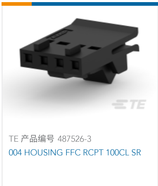
TE 产品编号 487526-3 004 HOUSING FFC RCPT 100CL SR