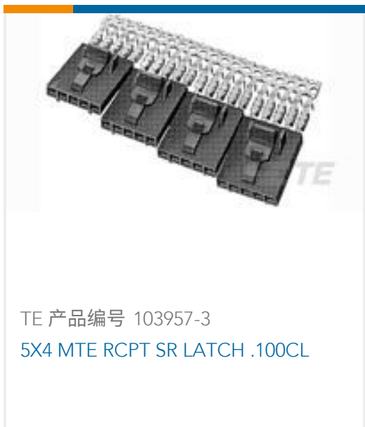
TE 产品编号 103957-3 5X4 MTE RCPT SR LATCH .100CL