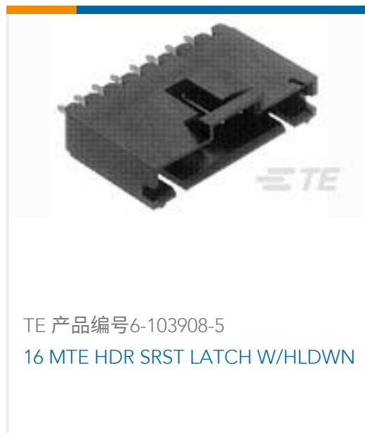
TE 产品编号6-103908-5 16 MTE HDR SRST LATCH W/HLDWN PEG