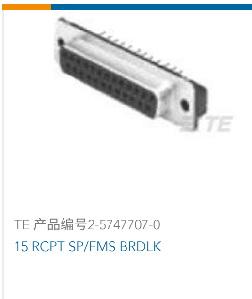
TE 产品编号2-5747707-0 15 RCPT SP/FMS BRDLK