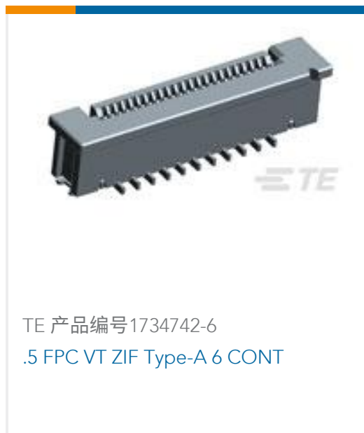
TE 产品编号1734742-6 .5 FPC VT ZIF Type-A 6 CONT