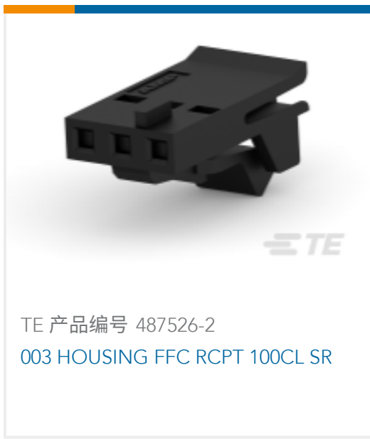
TE 产品编号 487526-2 003 HOUSING FFC RCPT 100CL SR