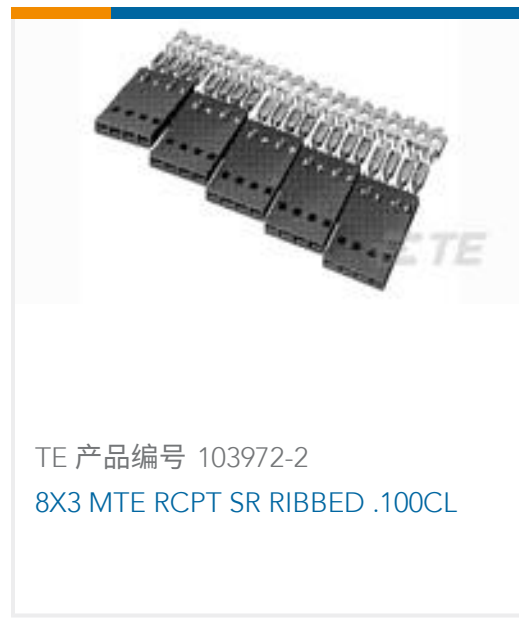
TE 产品编号 103972-2 8X3 MTE RCPT SR RIBBED .100CL