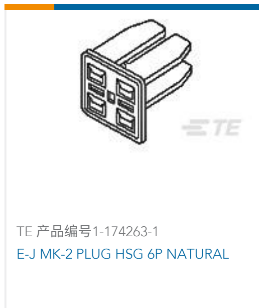
TE 产品编号1-174263-1 E-J MK-2 PLUG HSG 6P NATURAL