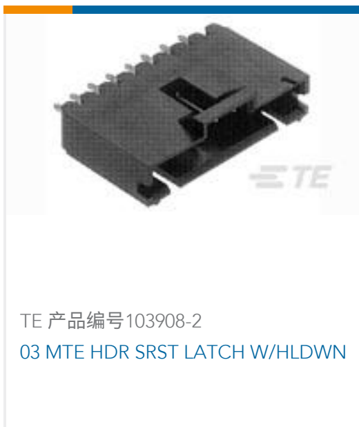
TE 产品编号103908-2 03 MTE HDR SRST LATCH W/HLDWN