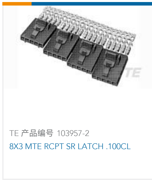
TE 产品编号 103957-2 8X3 MTE RCPT SR LATCH .100CL