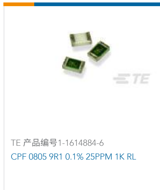
TE 产品编号1-1614884-6 CPF 0805 9R1 0.1% 25PPM 1K RL