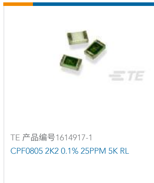
TE 产品编号1614917-1 CPF0805 2K2 0.1% 25PPM 5K RL