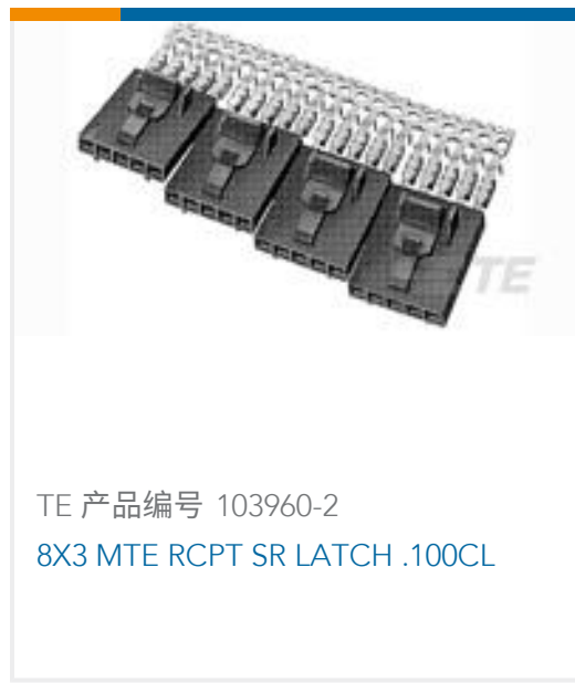
TE 产品编号 103960-2 8X3 MTE RCPT SR LATCH .100CL