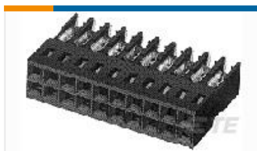
TE 产品编号6-102398-8 40 AMPMODU MT ASSY DR .100CL