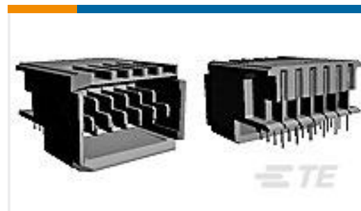
TE 产品编号5646959-1 UPM EXPANDED PIN ASSEMBLY