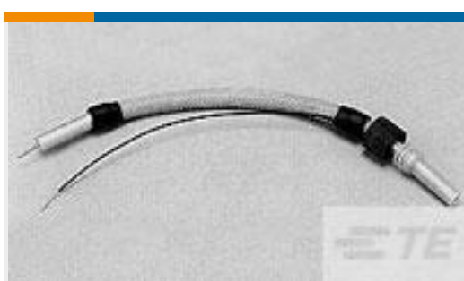
TE 产品编号5-862545-6 LEAD, SGL END ASSY, LGH