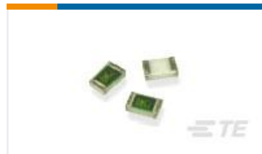
TE 产品编号4-1879127-1 RN 0402 340R 0.1% 10PPM 1K RL