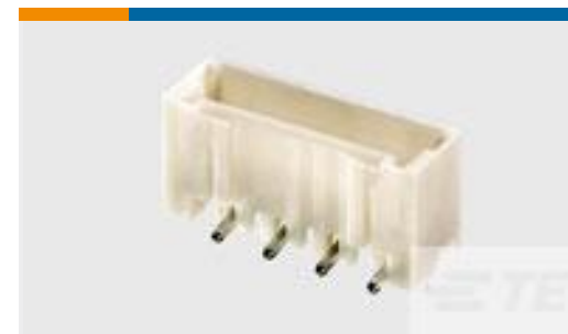
TE 产品编号5-292230-4 1.5 MINI CT SGL V SMT W/BOSS 4