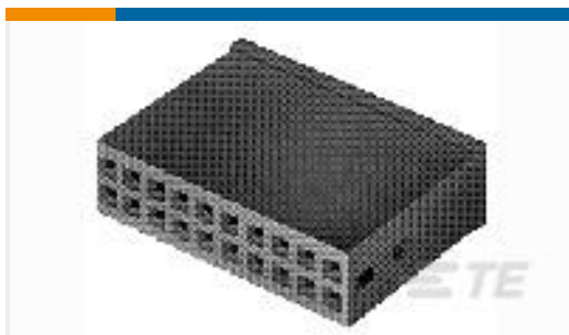
TE 产品编号925370-9 MOD IV REC HSG, 2X9P