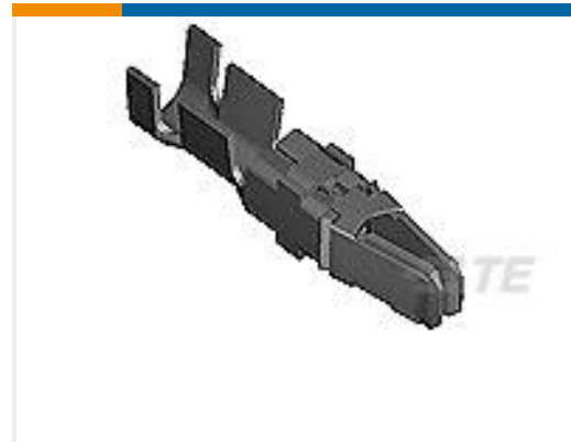
TE 产品编号2-66740-1 TYPE XII FEMALE CONT (LP)