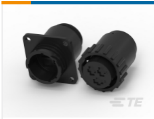
TE 产品编号206227-1 CPC 系列 3