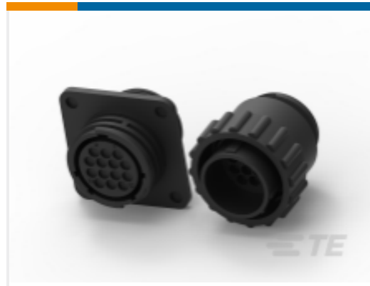
TE 产品编号206150-1 Circular Connector, Environmentally Sealed, CPC Series 6