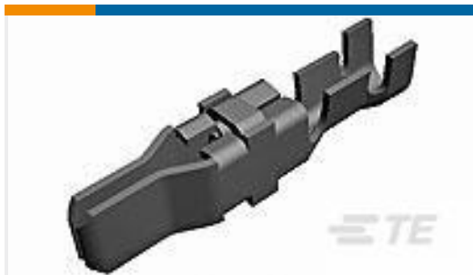
TE 产品编号66255-2 MALE CONTACT ASSY. (STRIP)