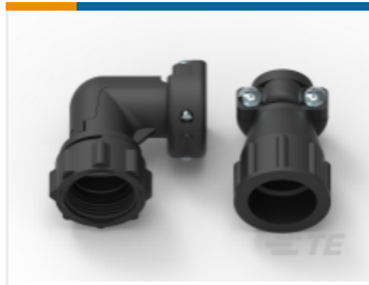
TE 产品编号1-206138-0 CPC Cable Clamps