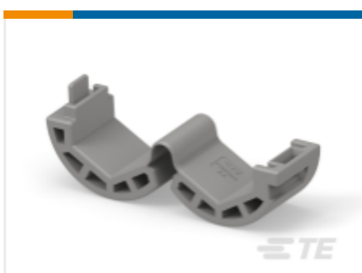
TE 产品编号2392560-2 SPACER, DIA 4MM, CVE40, MULTI CORE PLUG