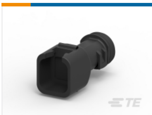
TE 产品编号1011-239-0605 BKSHL, 6P, BLK, PLG, ST, NW8.5/10/13