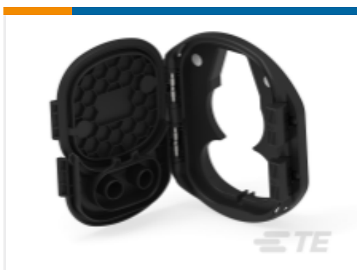
TE 产品编号2358664-2 Charging Inlets Flap Assembly DT, A