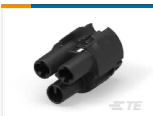
TE 产品编号1-2392563-1 3POS, SOC INNER HSG, DIA 4MM, COD A, CVE