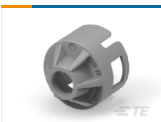
TE 产品编号2392559-2 SOC CONN CVR, 3POS, DIA 4MM, ICT CVE