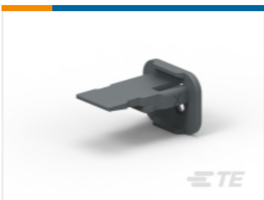
TE 产品编号W2SA-P012 WEDGE LOCK, 2P, PLG, GRY, SL RET, DT, A