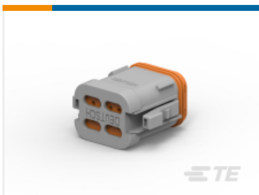
TE 产品编号DT06-08SA-C017 PLG, 8P, GRY, BLOCKED, A