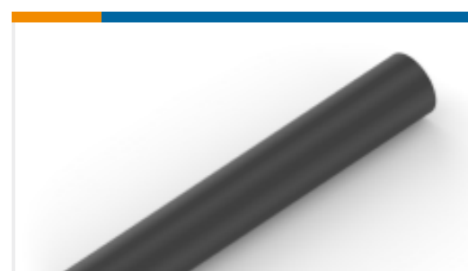
TE 产品编号NB10802001 ATUM-32/8-0-STK