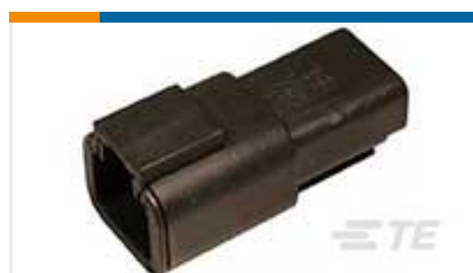
TE 产品编号DTP04-2P-E004 REC, 2P, BLK, N