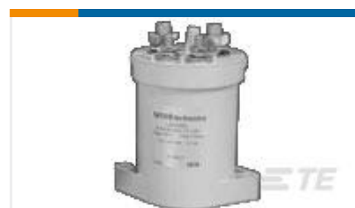
TE 产品编号3-1618389-7 LEV100A4ANG=RELAY, 12Vdc SPST-NO