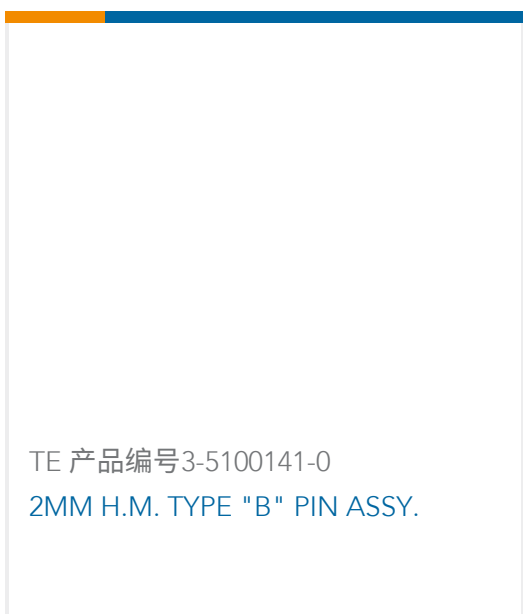
TE 产品编号3-5100141-0 2MM H.M. TYPE "B" PIN ASSY.