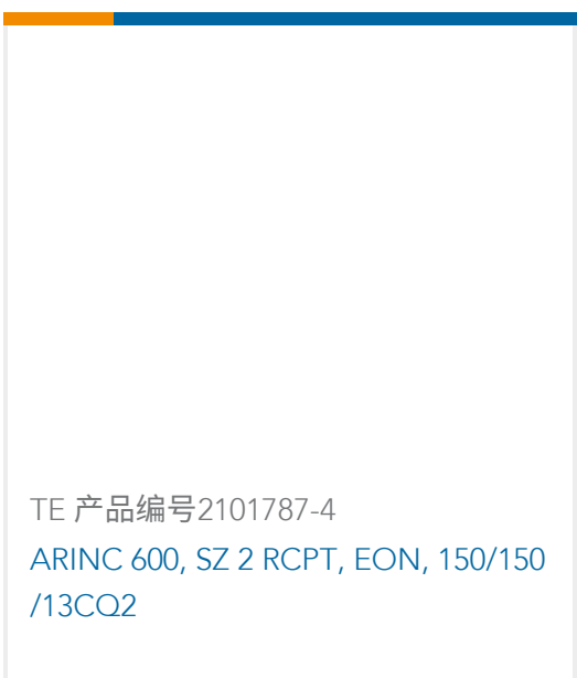
TE 产品编号2101787-4 ARINC 600, SZ 2 RCPT, EON, 150/150 /13CQ2