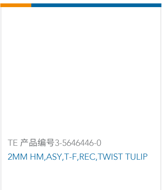
TE 产品编号3-5646446-0 2MM HM,ASY,T-F,REC,TWIST TULIP /13CQ2