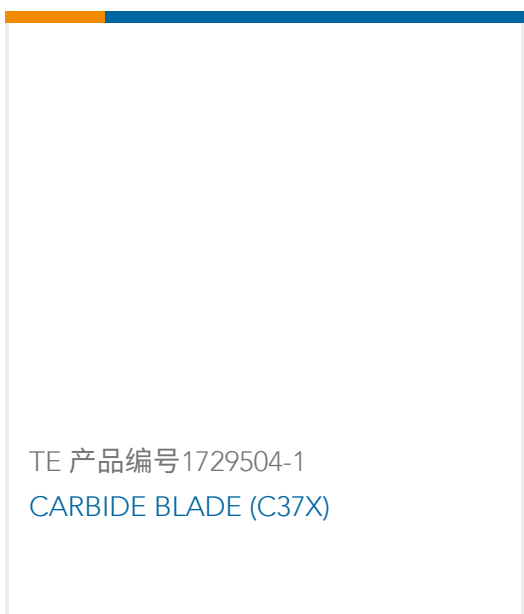
TE 产品编号1729504-1 CARBIDE BLADE (C37X)