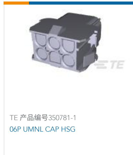
TE 产品编号350781-1 06P UMNL CAP HSG