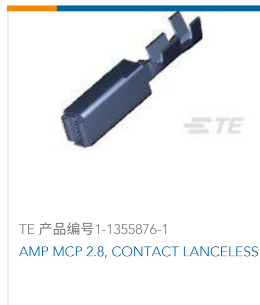
TE 产品编号1-1355876-1 AMP MCP 2.8, CONTACT LANCELESS