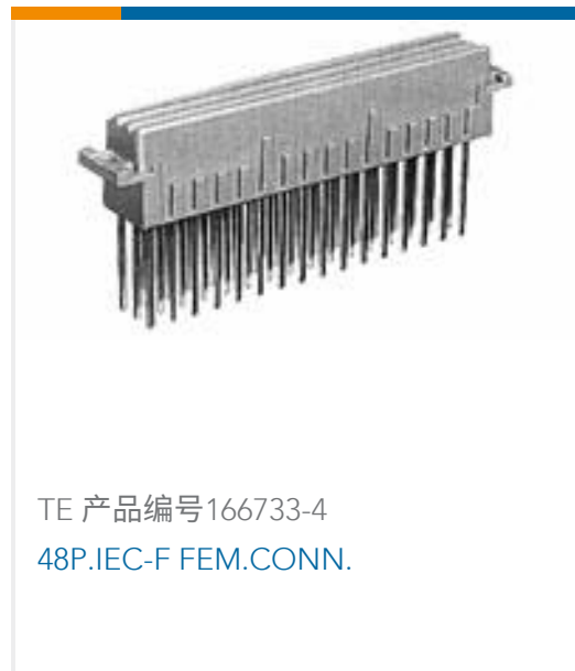
TE 产品编号166733-4 48P.IEC-F FEM.CONN.