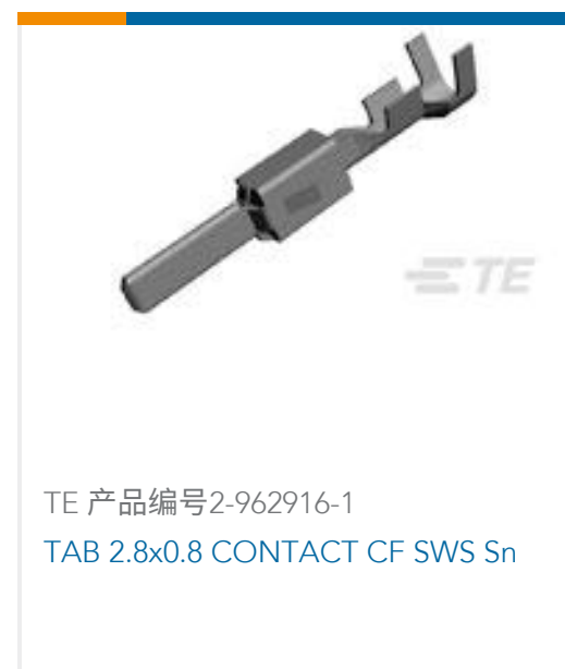
TE 产品编号2-962916-1 TAB 2.8x0.8 CONTACT CF SWS Sn