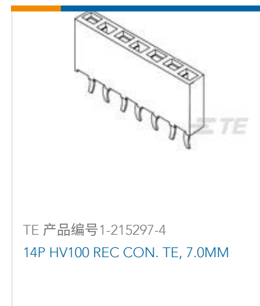
TE 产品编号1-215297-4 14P HV100 REC CON. TE, 7.0MM