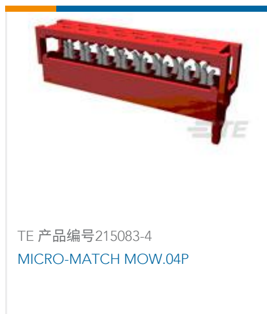
TE 产品编号215083-4 MICRO-MATCH MOW.04P