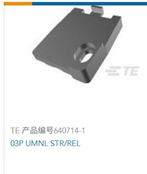
TE 产品编号640714-1 03P UMNL STR/REL