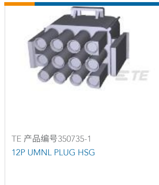
TE 产品编号350735-1 12P UMNL PLUG HSG