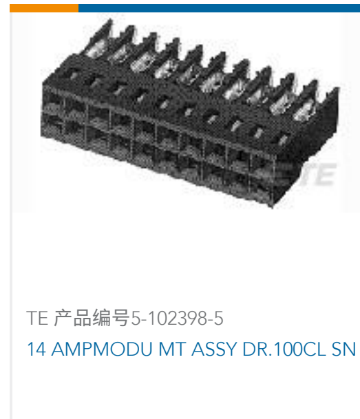
TE 产品编号5-102398-5 14 AMPMODU MT ASSY DR.100CL SN