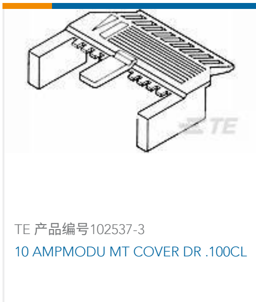
TE 产品编号102537-3 10 AMPMODU MT COVER DR .100CL