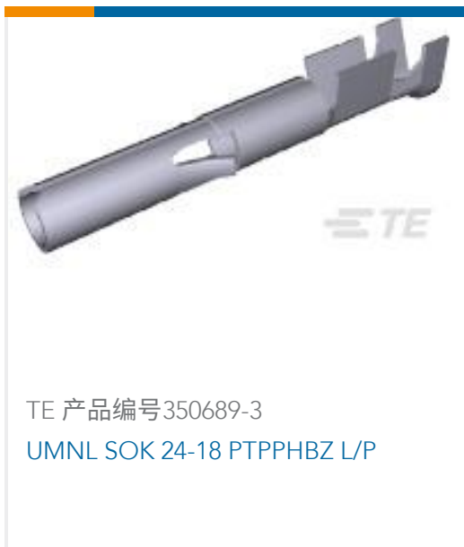
TE 产品编号350689-3 UMNL SOK 24-18 PTPPHBZ L/P