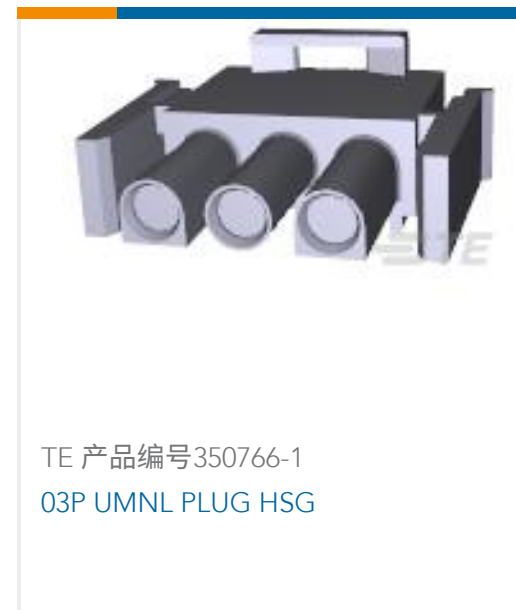
TE 产品编号350766-1 03P UMNL PLUG HSG