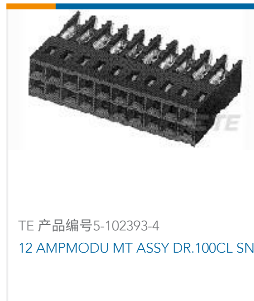
TE 产品编号5-102393-4 12 AMPMODU MT ASSY DR.100CL SN