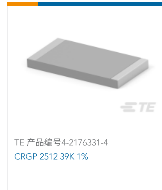
TE 产品编号4-2176331-4 CRGP 2512 39K 1%