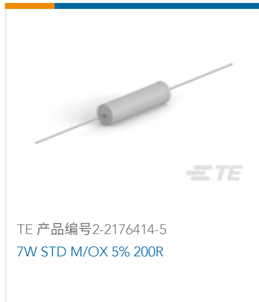
TE 产品编号2-2176414-5 7W STD M/OX 5% 200R