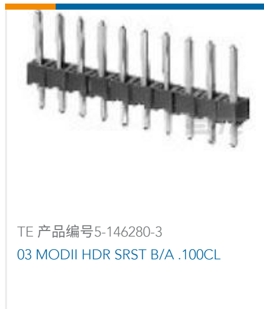
TE 产品编号5-146280-3 03 MODII HDR SRST B/A .100CL