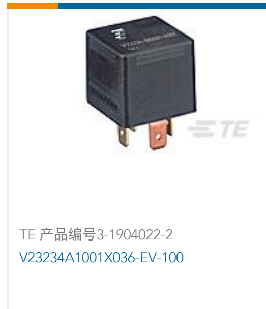
TE 产品编号3-1904022-2 V23234A1001X036-EV-100