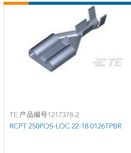
TE 产品编号1217378-2 RCPT 250POS-LOC 22-18 0126TPBR