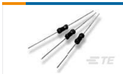
TE 产品编号1-1625893-4 5W SM M/OX 2% 27R