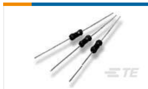
TE 产品编号7-1879350-5 RR01 5% 270R AMMO