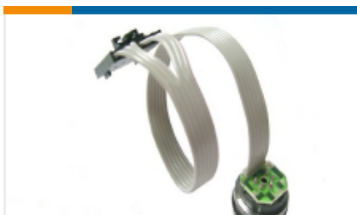
TE 产品编号86-100G-R 100 PSIG RIBBON CABLE MV PRESSURE SENSOR