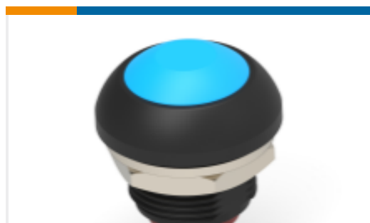
TE 产品编号2-2329383-5 PB ON/OFF FC BLU M1 TERM IP68