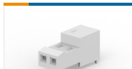
TE 产品编号 3-641537-2 MTA Receptacle: Nylon, Tin Plated, 2.54 mm