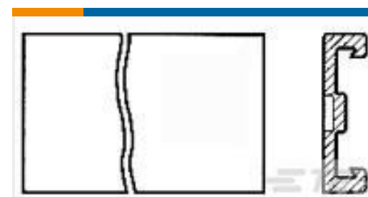
TE 产品编号 640643-3 03P MTA156 COVER F/T