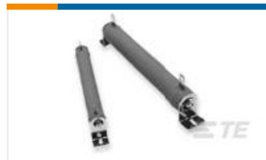
TE 产品编号1-1879447-8 TE 200W 27R 5% Bracket