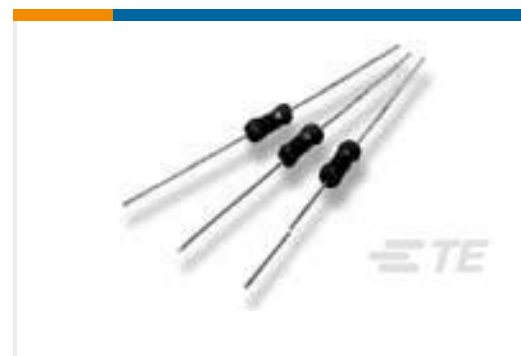
TE 产品编号1-1625893-4 5W SM M/OX 2% 27R