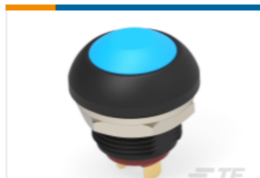
TE 产品编号2-2329383-5 PB ON/OFF FC BLU M1 TERM IP68