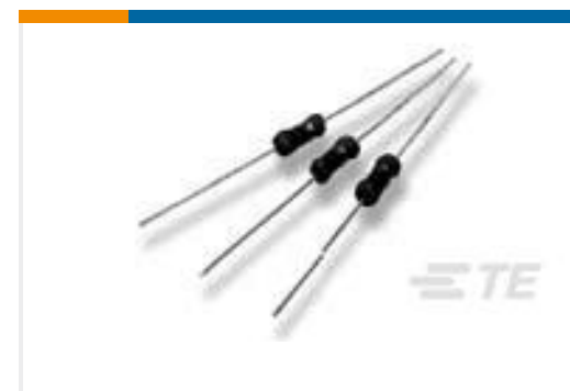
TE 产品编号7-1879350-5 RR01 5% 270R AMMO