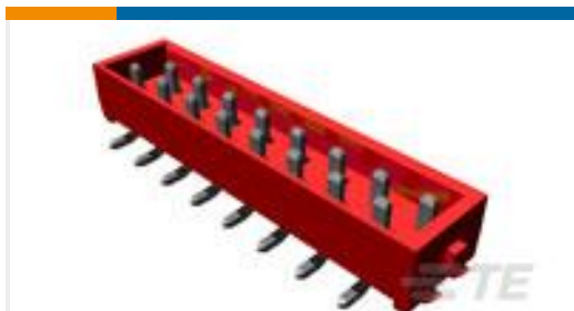
TE 产品编号8-338728-4 MICROM. MOB SMD CON