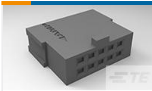
TE 产品编号 487223-8 030 HOUSING FFC RCPT 100CL DR