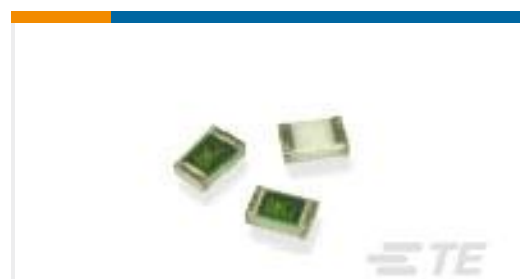
TE 产品编号3-1879134-1 RN 0603 20K5 0.1% 10PPM 1K RL