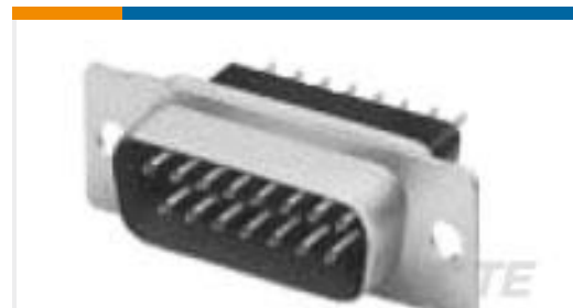
TE 产品编号205714-7 37 PLUG SP/MS STD