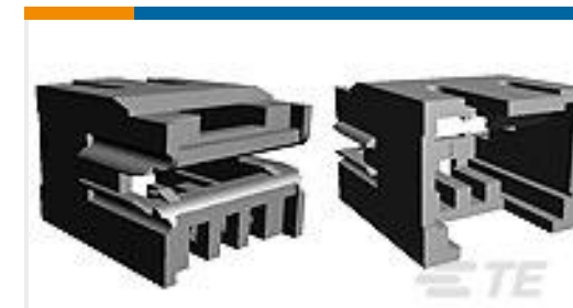
TE 产品编号1-964575-5 PCB RAHMEN 5P