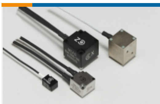
速率和惯性传感器(8)