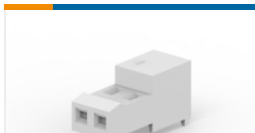
TE 产品编号3-641537-2 MTA Receptacle: Nylon, Tin Plated, 2.54 mm