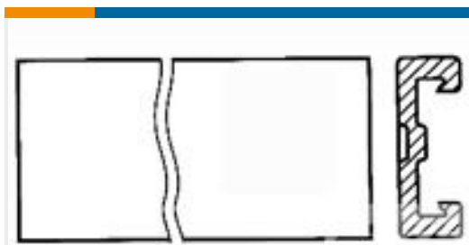
TE 产品编号640642-4 04P MTA100 COVER F/T