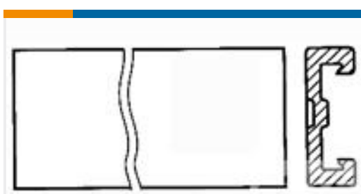
TE 产品编号640642-4 04P MTA100 COVER F/T