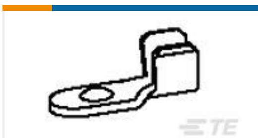
TE 产品编号62153-1 WELD TAB 20-16 AWG TPSTL