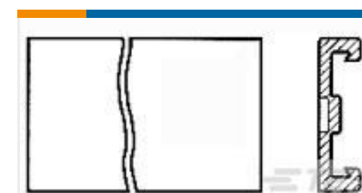
TE 产品编号640643-3 03P MTA156 COVER F/T