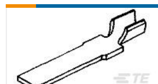
TE 产品编号62827-1 WELD TAB 24-22 AWG SST