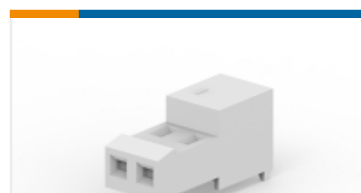
TE 产品编号3-641537-2 MTA Receptacle: Nylon, Tin Plated, 2.54 mm