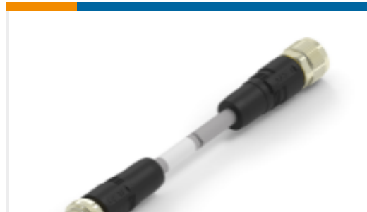
TE 产品编号TAA755A1611-080 M12A5-MS-FS-PVC-8.0M