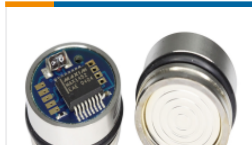
TE 产品编号86A3R-000000-100PG 100 PSIG ANALOG PRESSURE SENSOR