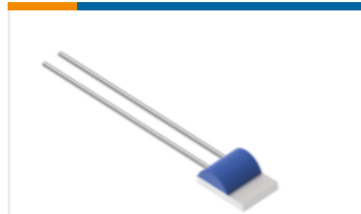
TE 产品编号NB-PTCO-163 Pt1000, 2.0x2.3, Class C, PTFC102C1A0