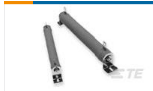
TE 产品编号1-1879447-8 TE 200W 27R 5% Bracket