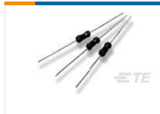
TE 产品编号7-1879350-5 RR01 5% 270R AMMO