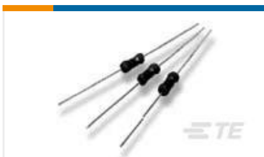
TE 产品编号4-1879355-9 RR03 5% 430K AMMO