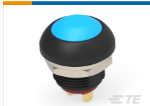
TE 产品编号2-2329383-5 PB ON/OFF FC BLU M1 TERM IP68