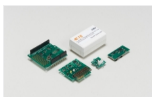
传感器开发板和评估套件(3)