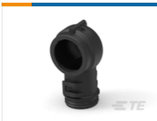
TE 产品编号SMBR-01-U DIN72585 BACKSHELL 90 strain relief