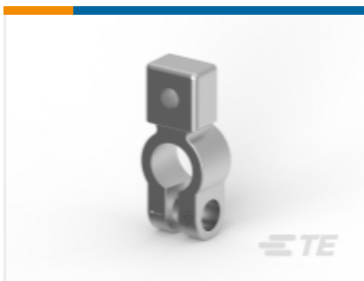
TE 产品编号HC5901 BATT.POST CLAMP -VE MK.3