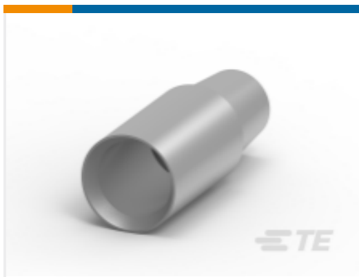
TE 产品编号HC5735 50MM2 NEGATIVE BAT LEAD 1/4" UNC THREAD