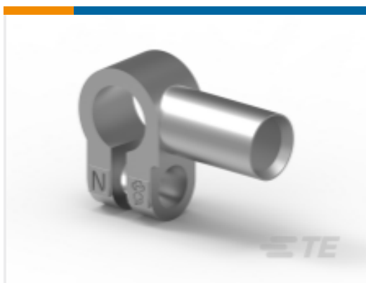
TE 产品编号HC5841 70MM2 BATTERY CLMP ASSMB NEGATIVE