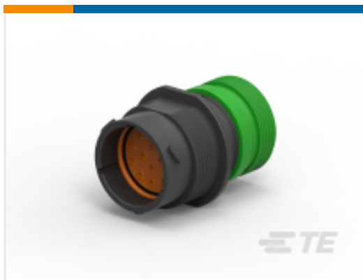
TE 产品编号HDP24-18-14PE-L015 REC, 14P, BLK, E, THD, 16, P