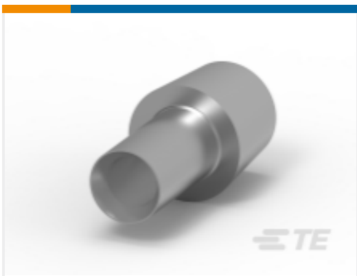
TE 产品编号HC5728 LEAD CONNECTOR 16MM