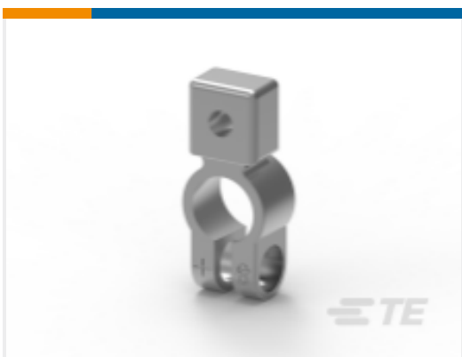
TE 产品编号HC5899 BAT CONNECTOR POS8MM AUXILLARY MNT