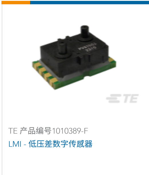
TE 产品编号1010389-F LMI - 低压差数字传感器