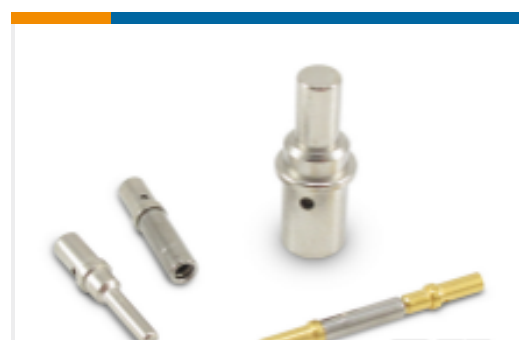
TE 产品编号0460-202-16141 DEUTSCH Solid Contacts