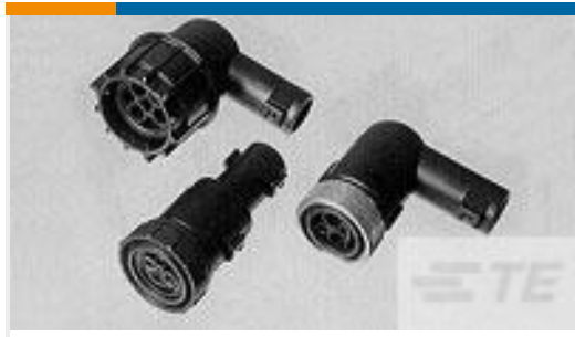
TE 产品编号 100863-2 12P.ECONS.PLG.1,5MM