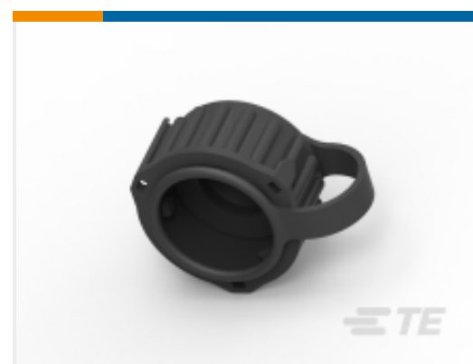
TE 产品编号 CAT-C4962-B128 Circular DIN Backshells