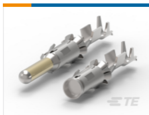
TE 产品编号 CAT-R7602-T273 圆形连接器系统，插针和插座