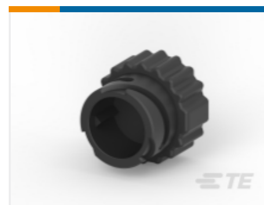
TE 产品编号 185636-1 PROTECT CAP 2.5MM PLUG