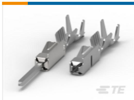
TE 产品编号5-963716-1 MQS, 母端和公端