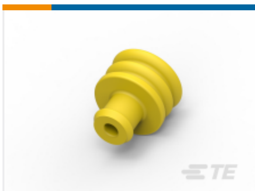
TE 产品编号2236402-1 SINGLE WIRE SEAL,AMP MCP2.8