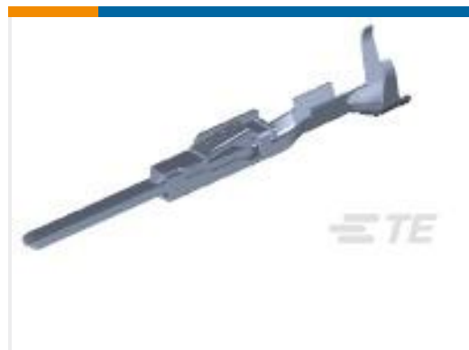
TE 产品编号1718758-3 MCON 1.2 LL TAB SWS AG