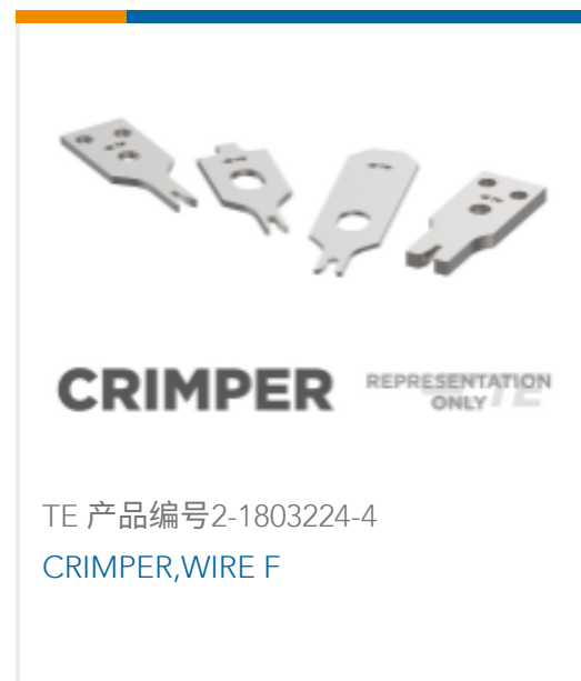
TE 产品编号2-1803224-4 CRIMPER,WIRE F