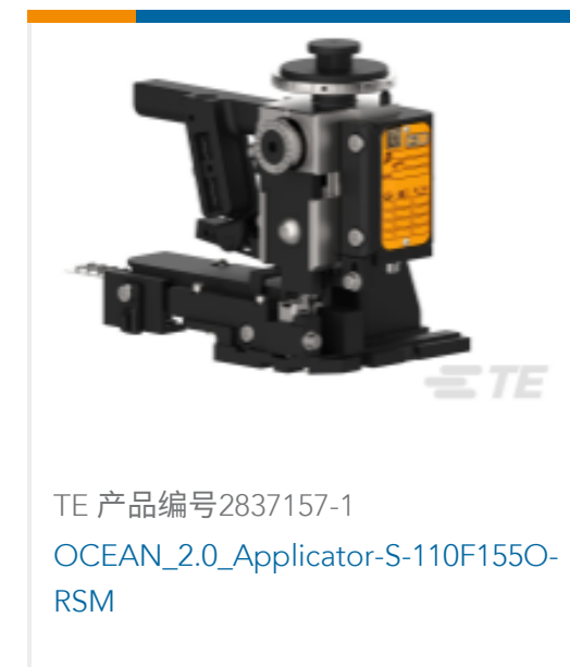
TE 产品编号2837157-1 OCEAN_2.0_Applicator-S-110F155O-RSM