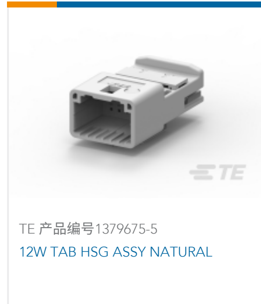
TE 产品编号1379675-5 12W TAB HSG ASSY NATURAL