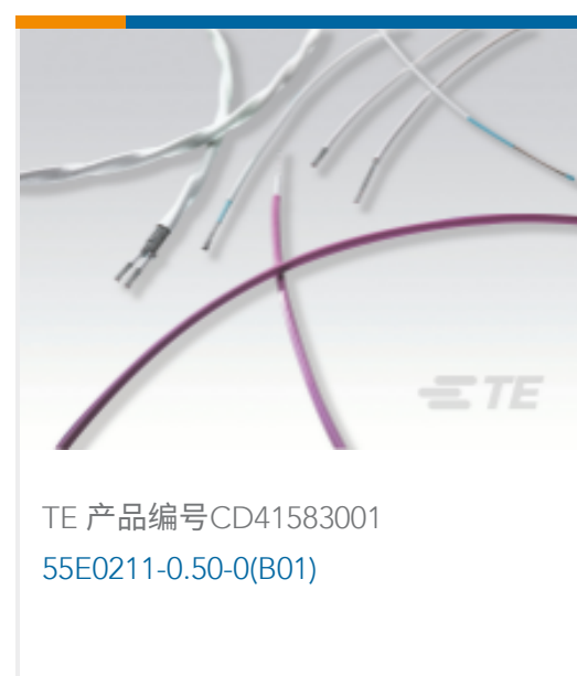
TE 产品编号CD41583001 55E0211-0.50-0(B01)