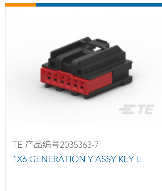
TE 产品编号2035363-7 1X6 GENERATION Y ASSY KEY E