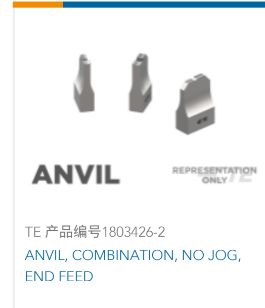
TE 产品编号1803426-2 ANVIL, COMBINATION, NO JOG, END FEED