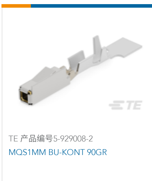
TE 产品编号5-929008-2 MQS1MM BU-KONT 90GR