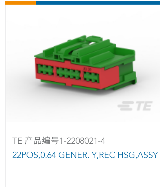
TE 产品编号1-2208021-4 22POS,0.64 GENER. Y,REC HSG,ASSY