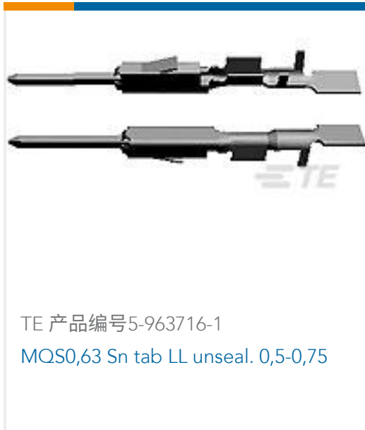
TE 产品编号5-963716-1 MQS0,63 Sn tab LL unseal. 0,5-0,75