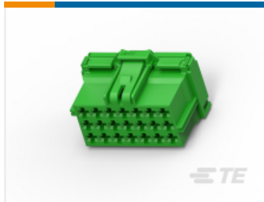
TE 产品编号1-967627-1 AMP MCP Unsealed Connector Housings