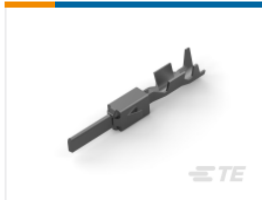
TE 产品编号1-963746-1 SPECIAL TERMINAL 17-13 AWG PTPB LP