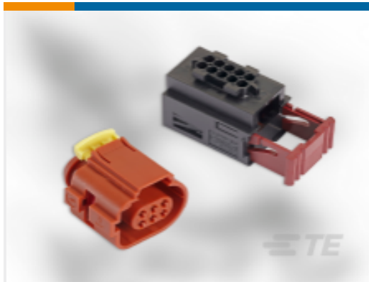
TE 产品编号1-967623-1 Timer Connector Housing