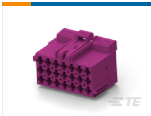
TE 产品编号1-967625-3 JUN-POW-TIM GEH 21P