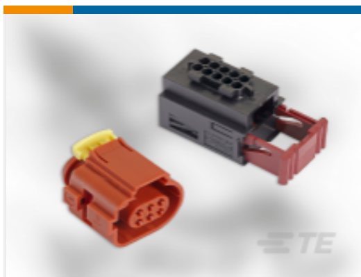
TE 产品编号1-967625-2 Timer Connector Housing