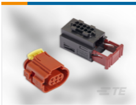
TE 产品编号1-967623-5 Timer Connector Housing