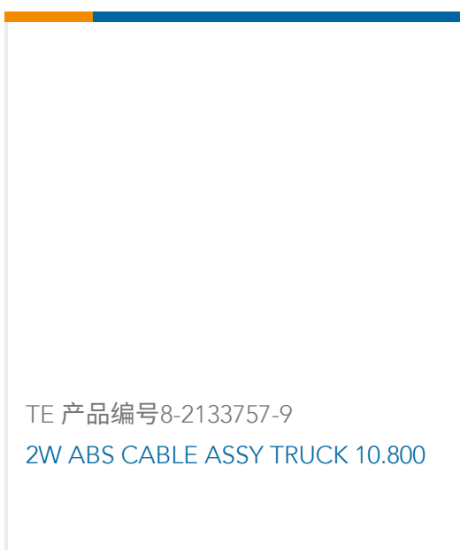
TE 产品编号8-2133757-9 2W ABS CABLE ASSY TRUCK 10.800