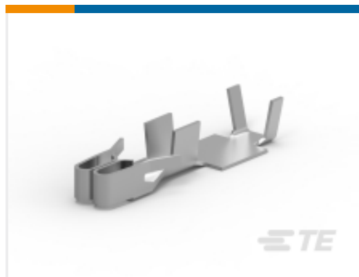
TE 产品编号880548-2 FUSE CONTACT BUS-BAR