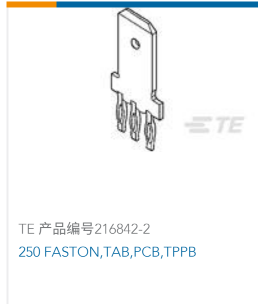
TE 产品编号216842-2 250 FASTON, TAB, PCB, TPPB