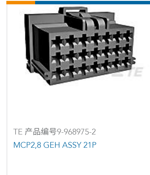
TE 产品编号9-968975-2 MCP2, 8 GEH ASSY 21P