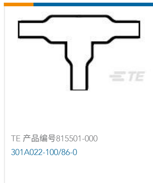
TE 产品编号815501-000 301A022-100/86-0