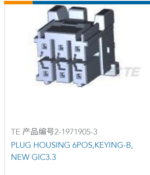
TE 产品编号2-1971905-3 PLUG HOUSING 6POS, KEYING-B, NEW GIC3.3