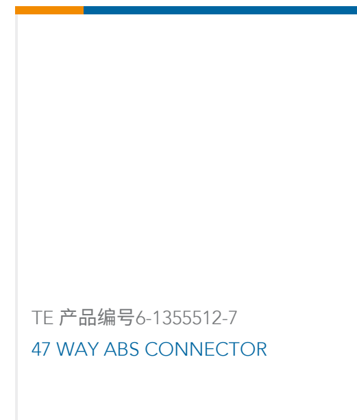
TE 产品编号6-1355512-7 47 WAY ABS CONNECTOR