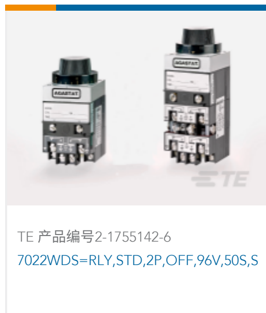
TE 产品编号2-1755142-6 7022WDS=RLY, STD, 2P, OFF, 96V, 50S, S