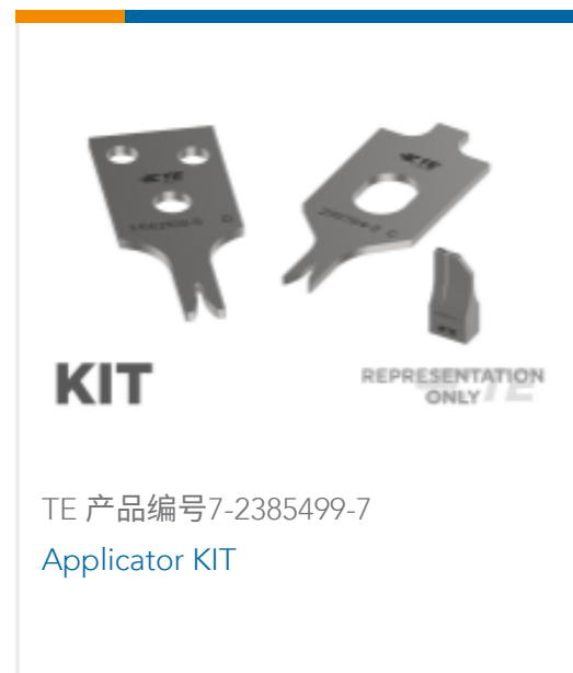
TE 产品编号7-2385499-7 Applicator KIT