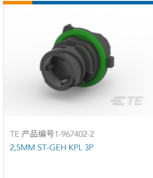
TE 产品编号1-967402-2 2,5MM ST-GEH KPL 3P