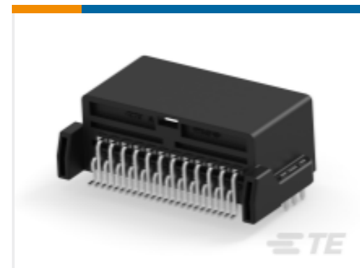
TE 产品编号2237067-1 24POS, TAB0.64X0.64, HDR ASSY, 90 DEG, SMD