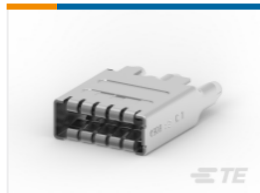
TE 产品编号1-1719101-1 PCB 9.5 TERMINAL SN