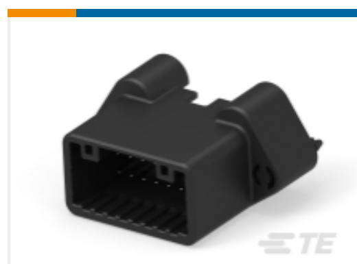
TE 产品编号2237022-1 16P 025 CAP ASSY