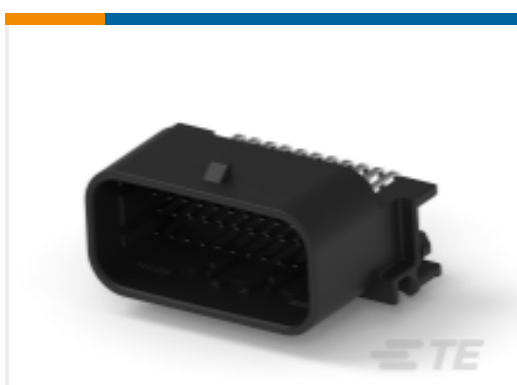
TE 产品编号1554458-2 33POS, 1.0X0.64, TAB HSG ASSY, SLD