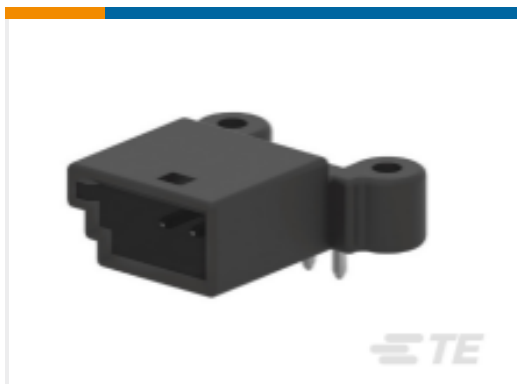
TE 产品编号175977-2 Signal Header