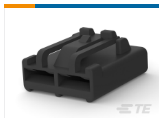
TE 产品编号1814890-1 2 WAY RECEPTACLE HSG. FASTI