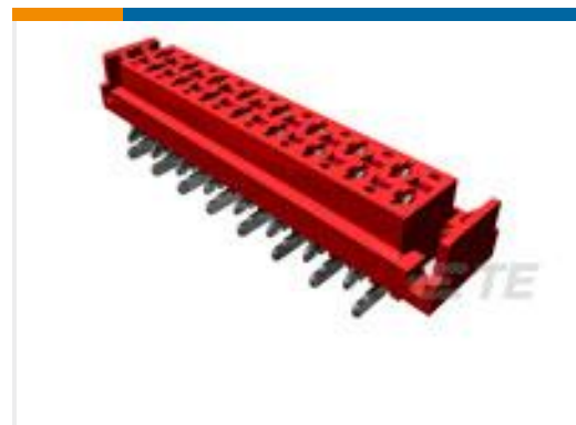
TE 产品编号338069-6 MICRO-MATCH SMD FTE