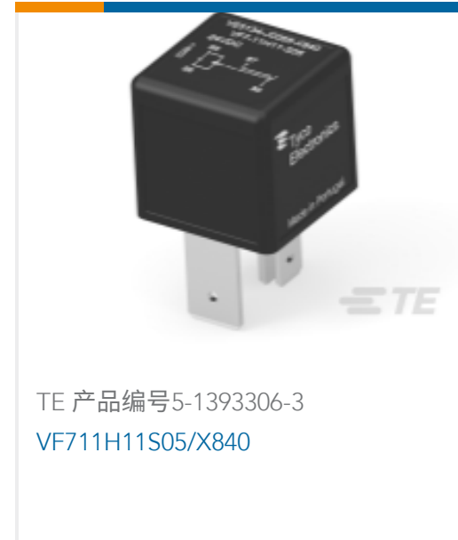
TE 产品编号5-1393306-3 VF711H11S05/X840