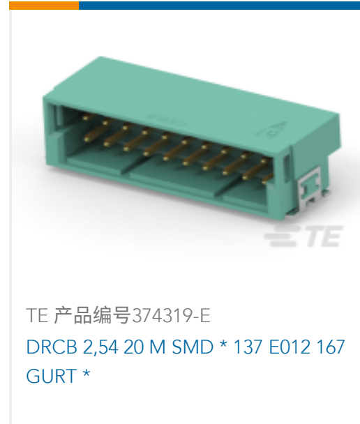
TE 产品编号374319-E DRCB 2,54 20 M SMD * 137 E012 167 GURT *