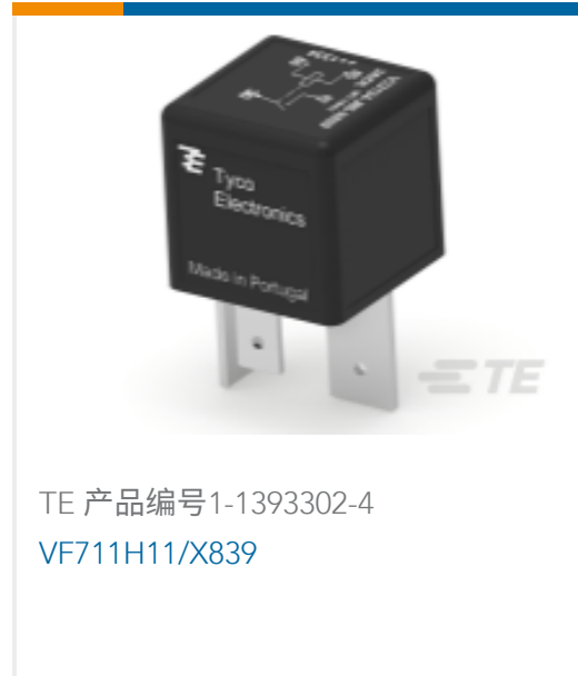
TE 产品编号1-1393302-4 VF711H11/X839