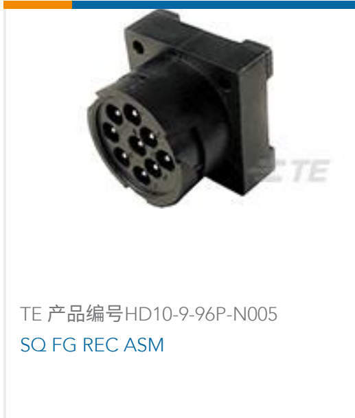
TE 产品编号HD10-9-96P-N005 SQ FG REC ASM