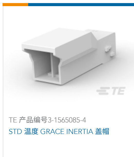
TE 产品编号3-1565085-4 STD 温度 GRACE INERTIA 盖帽