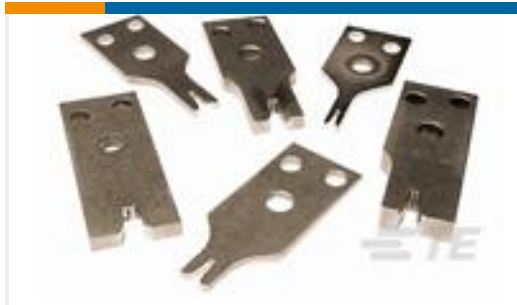
TE 产品编号1276120-3 CRIMPER,INSULATION