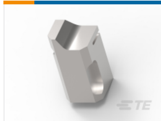
TE 产品编号724919-8 FLOAING SHEAR FRONT