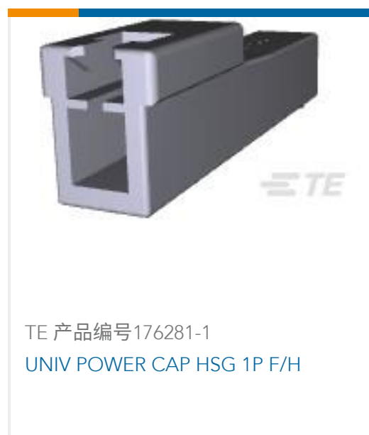
TE 产品编号176281-1 UNIV POWER CAP HSG 1P F/H