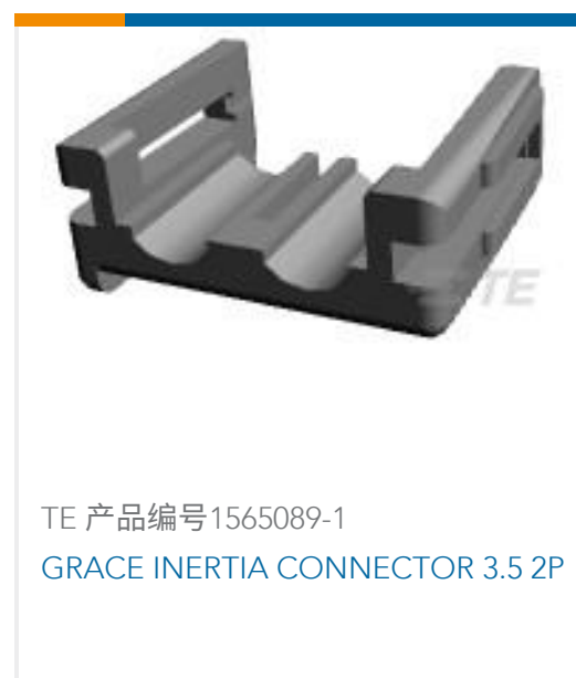
TE 产品编号1565089-1 GRACE INERTIA CONNECTOR 3.5 2P