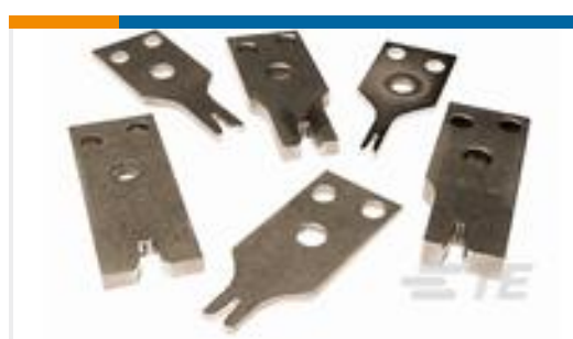
TE 产品编号1276120-1 CRIMPER,INSULATION