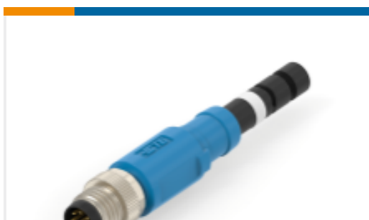
TE 产品编号T40611DS008-005 M8 MALE CORDSET,8PIN,ST,SH,SO, 5.0M