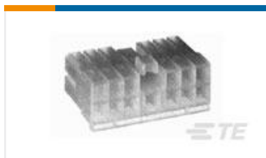
TE 产品编号172024-4 MIC PLUG 11P