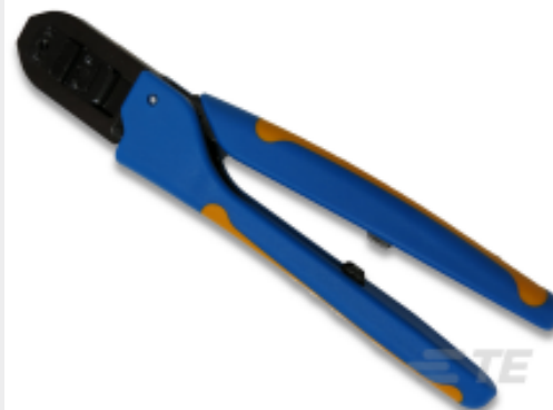
TE 产品编号 91560-1 CCII D-3 2L REC TAB 16-14 ASSY