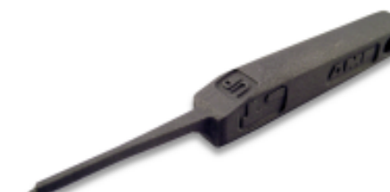
TE 产品编号 234168-1 EXTRACTION TOOL(DYNAMIC D-3)