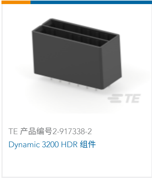
TE 产品编号2-917338-2 Dynamic 3200 HDR 组件