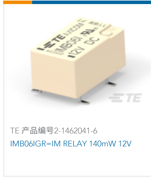
TE 产品编号2-1462041-6 IMB06IGR=IM RELAY 140mW 12V