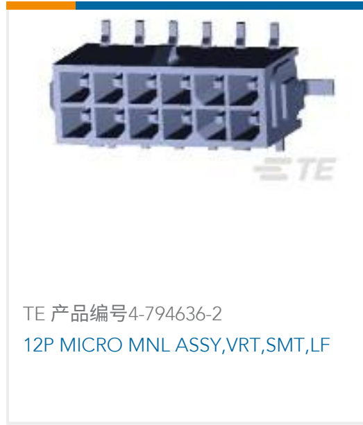
TE 产品编号4-794636-2 12P MICRO MNL ASSY,VRT,SMT,LF