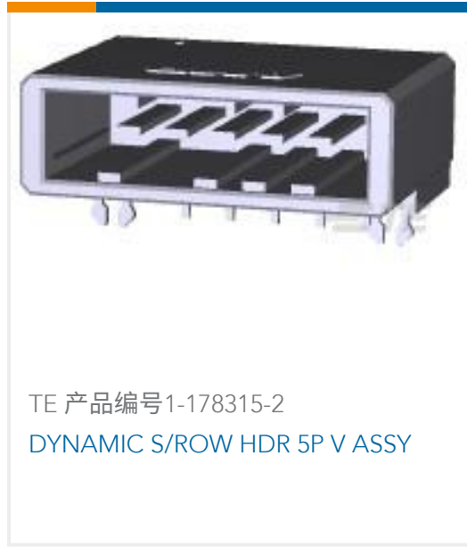
TE 产品编号1-178315-2 DYNAMIC S/ROW HDR 5P V ASSY