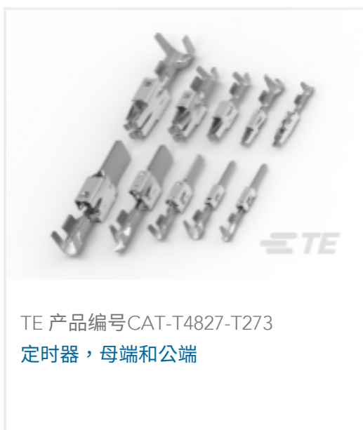
TE 产品编号CAT-T4827-T273 定时器，母端和公端