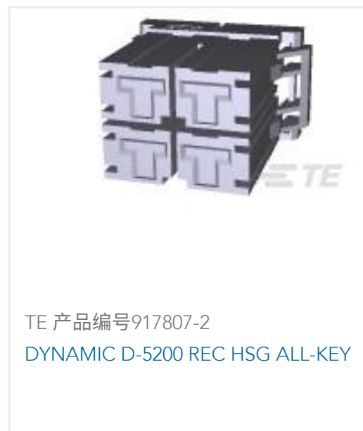
TE 产品编号917807-2 DYNAMIC D-5200 REC HSG ALL-KEY