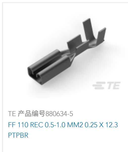
TE 产品编号880634-5 FF 110 REC 0.5-1.0 MM2 0.25 X 12.3 PTPBR