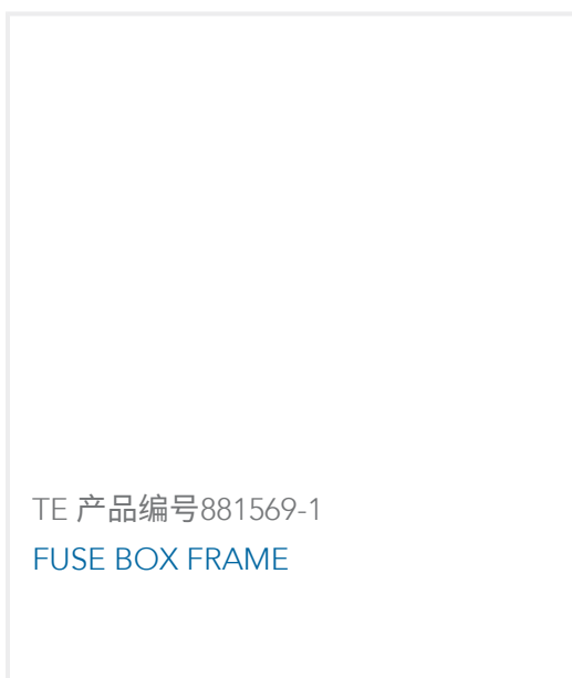
TE 产品编号881569-1 FUSE BOX FRAME