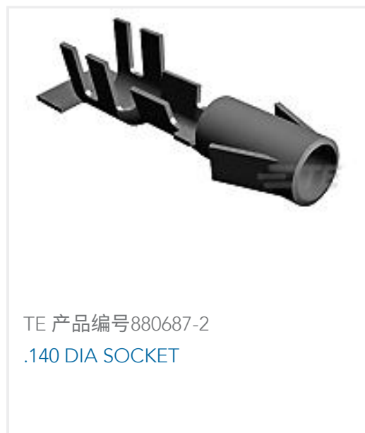
TE 产品编号880687-2 .140 DIA SOCKET