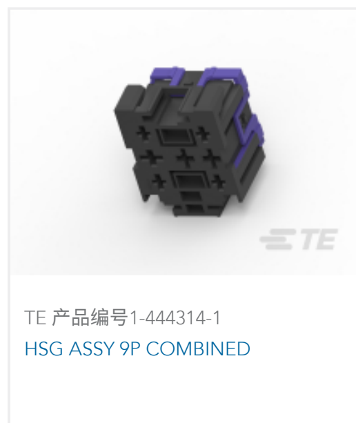
TE 产品编号1-444314-1 HSG ASSY 9P COMBINED