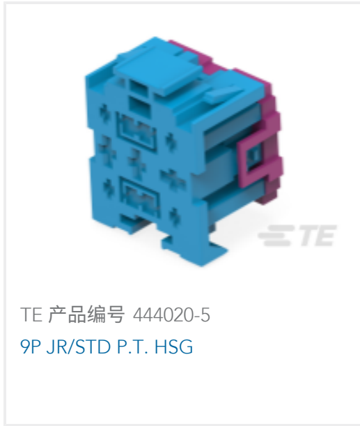
TE 产品编号 444020-5 9P JR/STD P.T. HSG