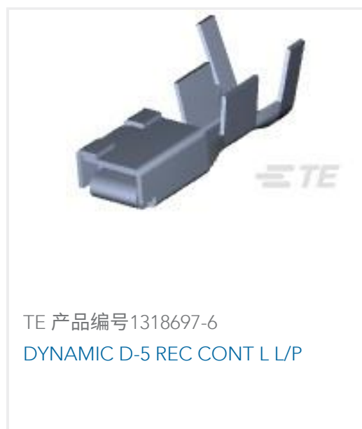
TE 产品编号1318697-6 DYNAMIC D-5 REC CONT L/L/P