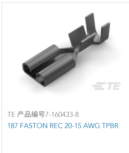
TE 产品编号7-160433-8 187 FASTON REC 20-15 AWG TPBR