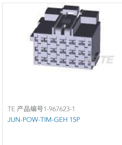
TE 产品编号1-967623-1 JUN-POW-TIM-GEH 15P