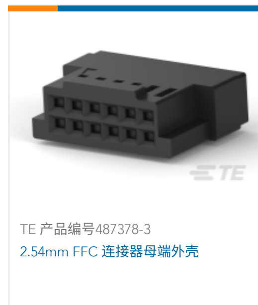
TE 产品编号487378-3 2.54mm FFC 连接器母端外壳