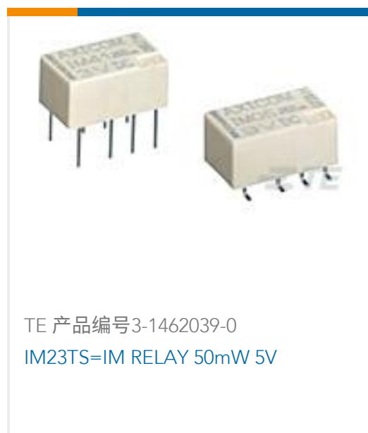
TE 产品编号3-1462039-0 IM23TS=IM RELAY 50mW 5V