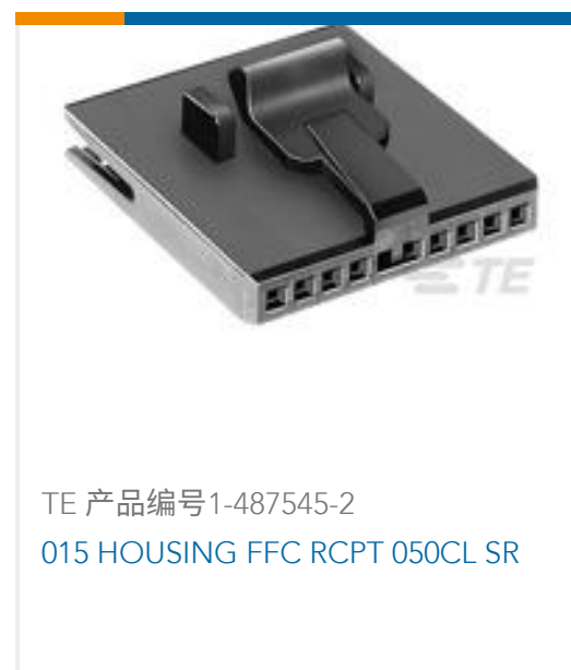
TE 产品编号1-487545-2 015 HOUSING FFC RCPT 050CL SR