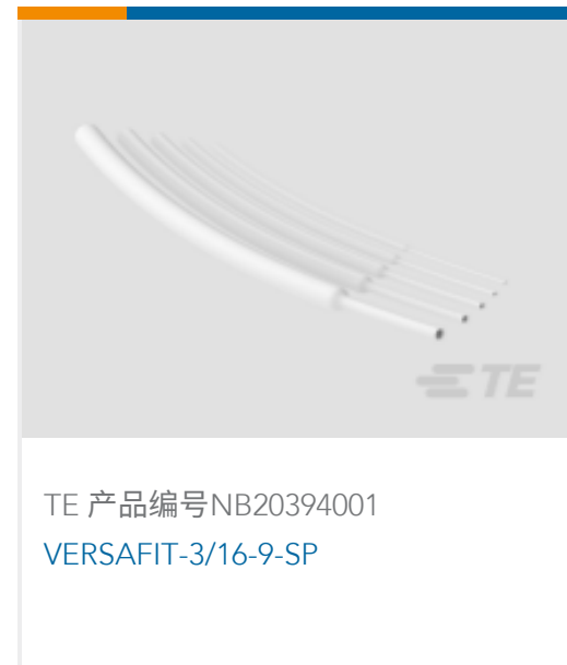
TE 产品编号NB20394001 VERSAFIT-3/16-9-SP