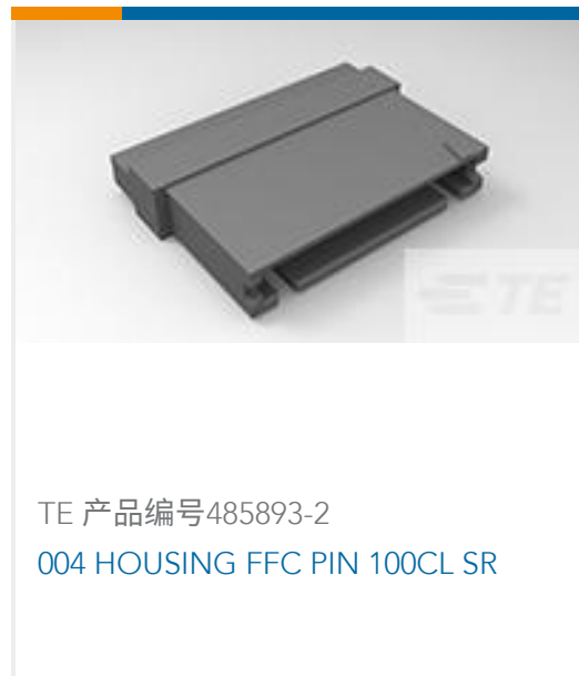
TE 产品编号485893-2 004 HOUSING FFC PIN 100CL SR