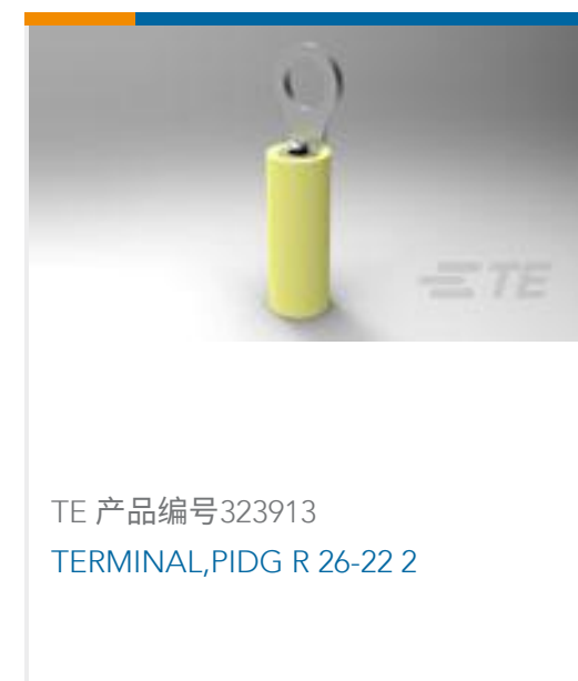
TE 产品编号323913 TERMINAL,PIDG R 26-22 2