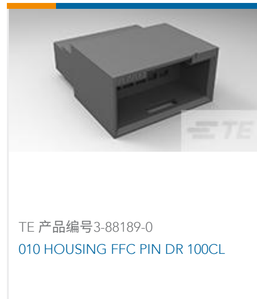
TE 产品编号3-88189-0 010 HOUSING FFC PIN DR 100CL