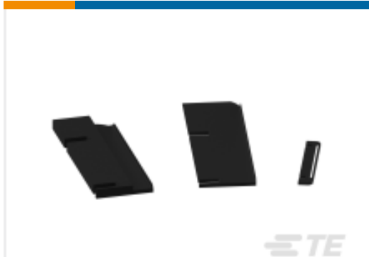
TE 产品编号2119959-2 ASSEMBLY, STRIP GUIDE