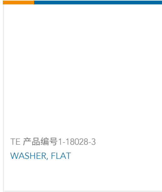
TE 产品编号1-18028-3 WASHER, FLAT