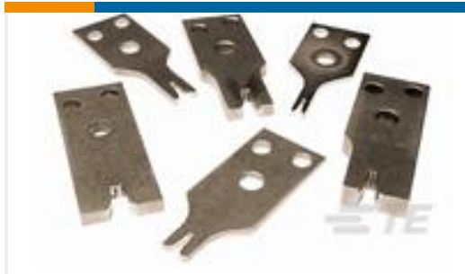
TE 产品编号3-1633860-8 CRIMPER, WIRE F