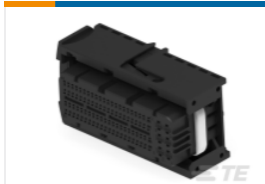
TE 产品编号7-1355136-3 94POS MIXED MQS REC SEALED