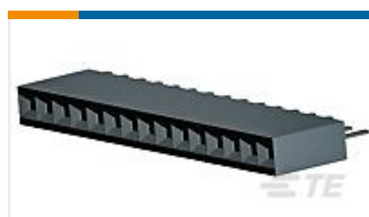
TE 产品编号 7-146386-0 15 MODII VRT SR CE 100/115