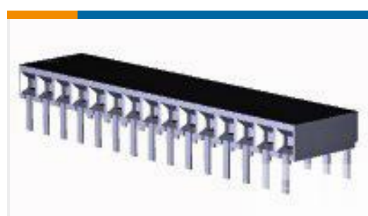
TE 产品编号 1-5535676-4 15 MODII HORZ SR CE 100CL