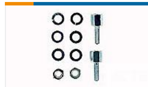
TE 产品编号5205817-3 FEMALE SCREWLOCK KIT