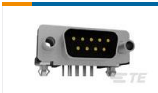
TE 产品编号5747844-6 09 MSFL RCPT RA 318 (SL,FM,BL)