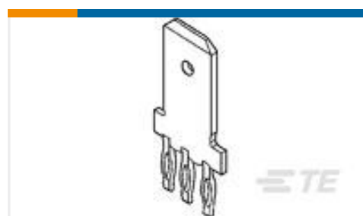
TE 产品编号216843-1 250 FASTON,TAB,PCB,TPPB