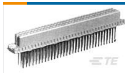
TE 产品编号1-148057-5 096 EURO TYP C RECP 13MM ASSY